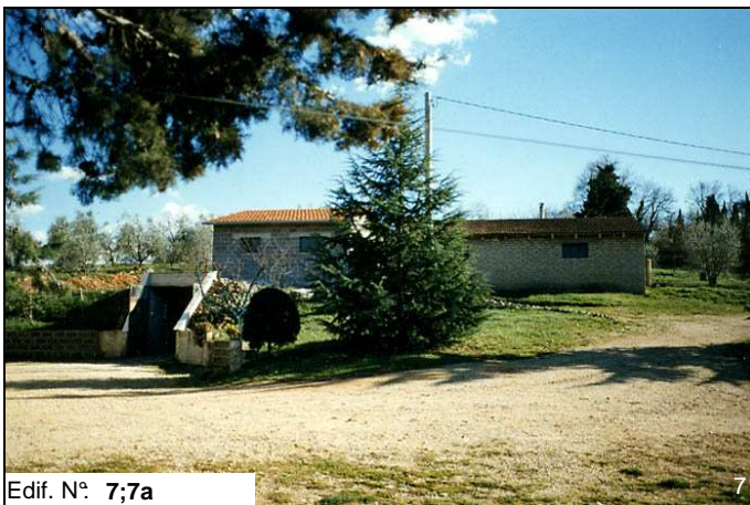
Edif. N° 7;7a