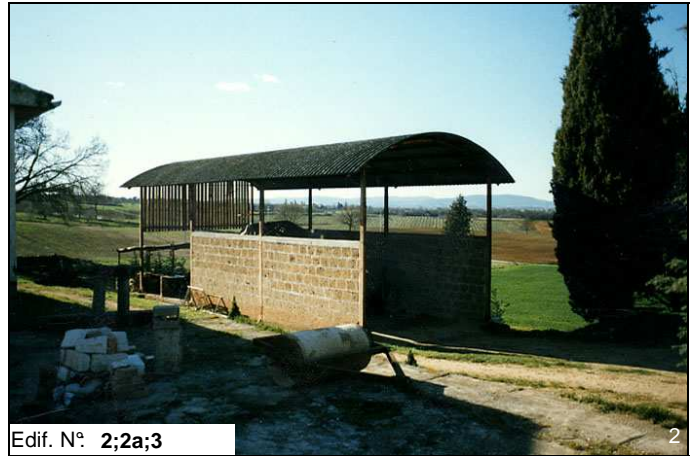
Edif. N° 2;2a;3