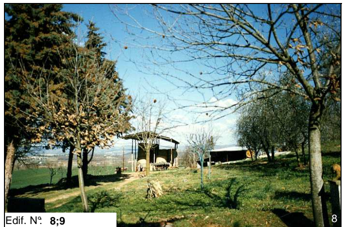
Edif. N° 8;9