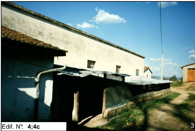
Edif. N° 4;4c