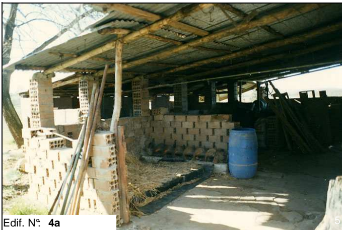
Edif. N° 4a