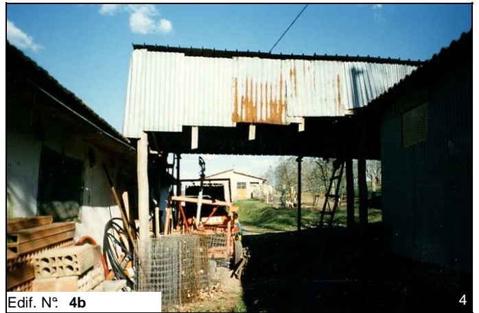
Edif. N° 4b