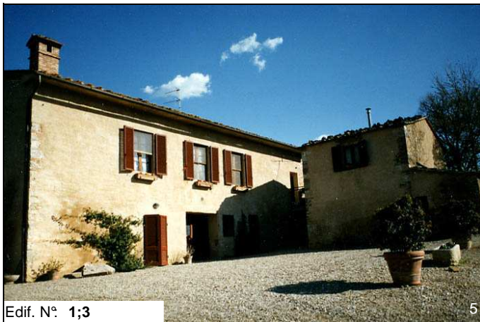
Edif. N° 1;3