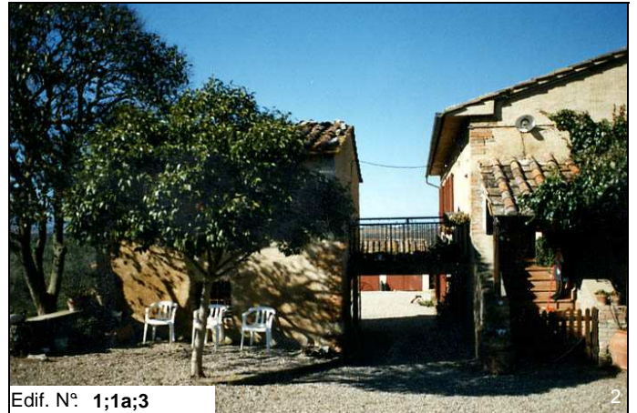
Edif. N° 1;1a;3