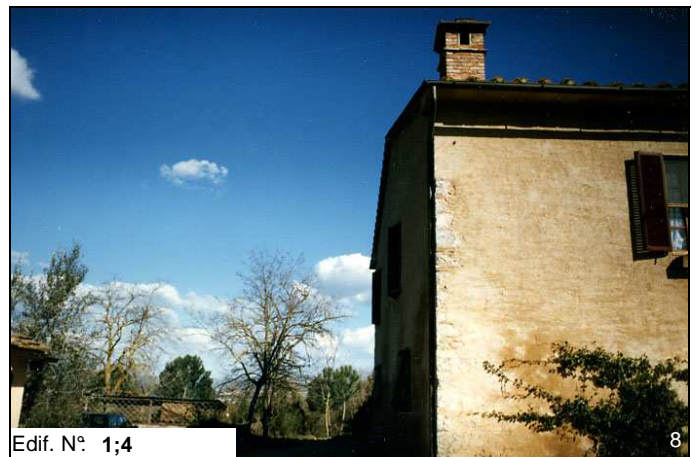
Edif. N° 1;4