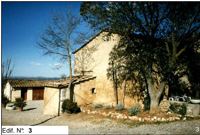
Edif. N° 3