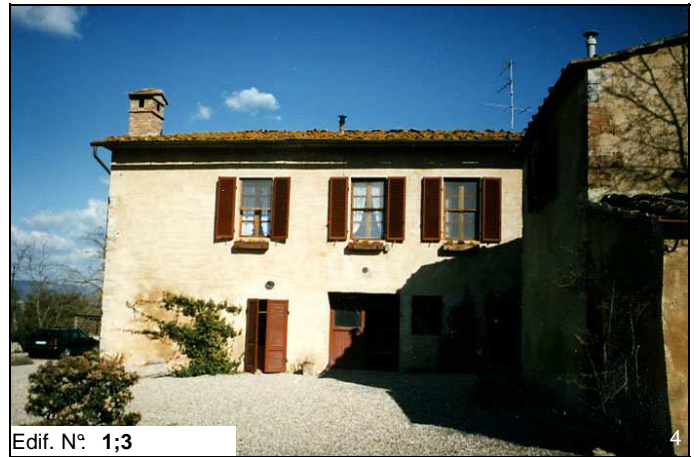
Edif. N° 1;3