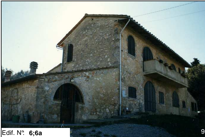
Edif. N° 6;6a