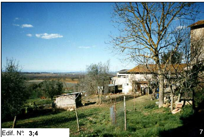
Edif. N° 3;4