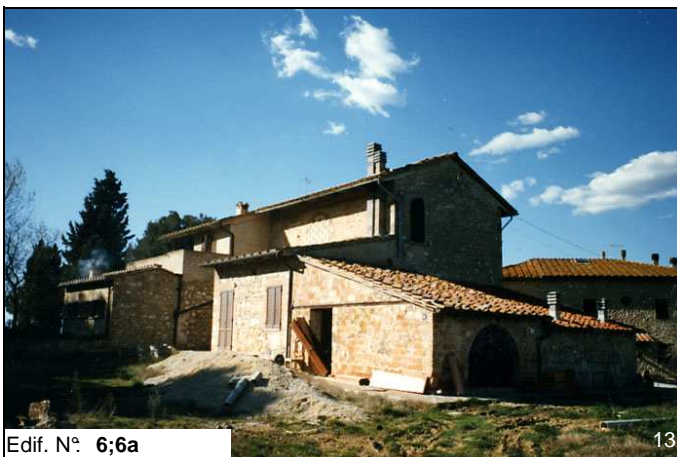
Edif. N° 6;6a