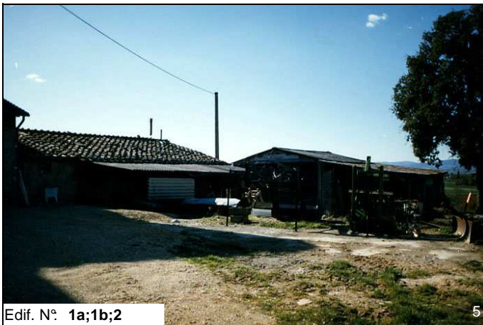
Edif. N° 1a;1b;2