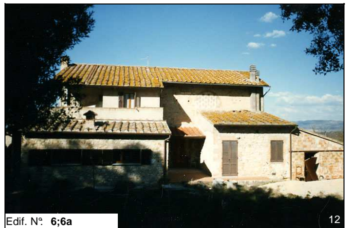
Edif. N° 6;6a