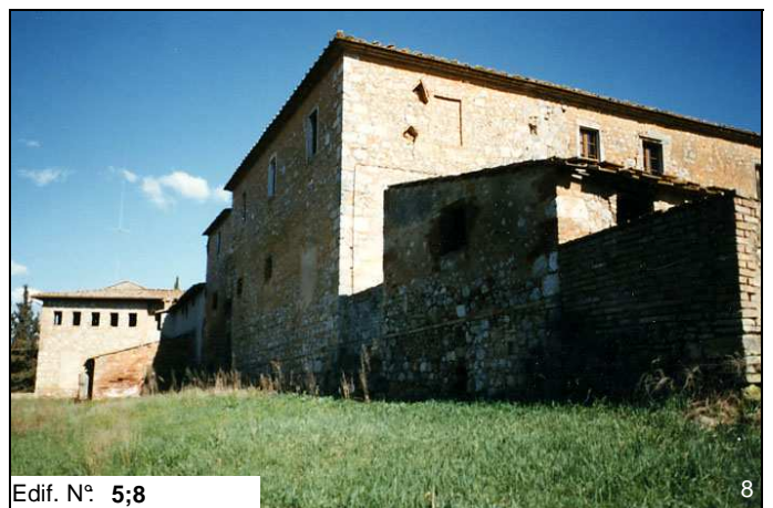
Edif. N° 5;8