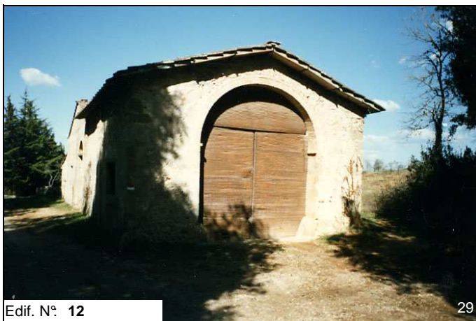
Edif. N° 12