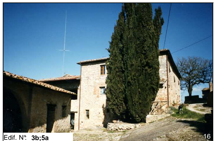
Edif. N° 3b;5a