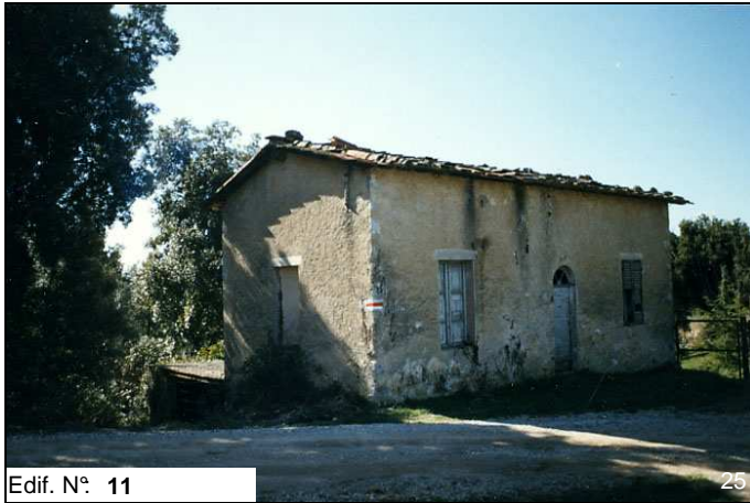
Edif. N° 11