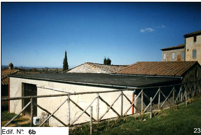
Edif. N° 6b