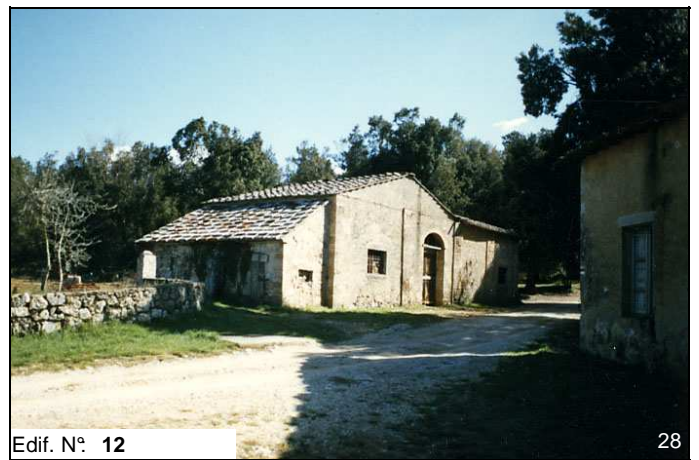
Edif. N° 12