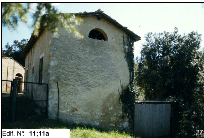
Edif. N° 11;11a