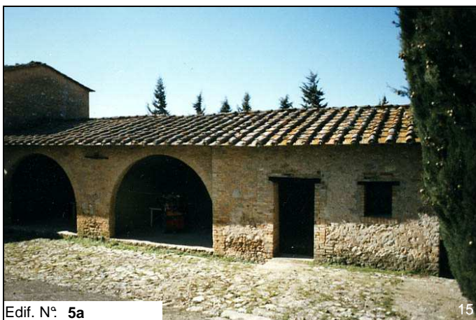
Edif. N° 5a