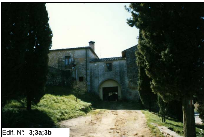
Edif. N° 3;3a;3b