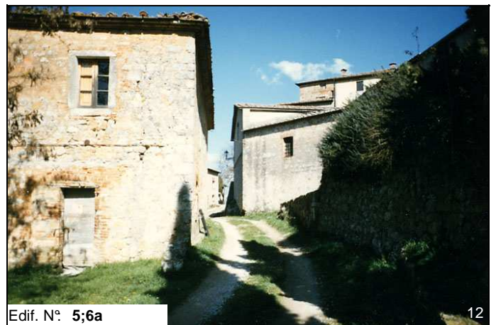
Edif. N° 5;6a