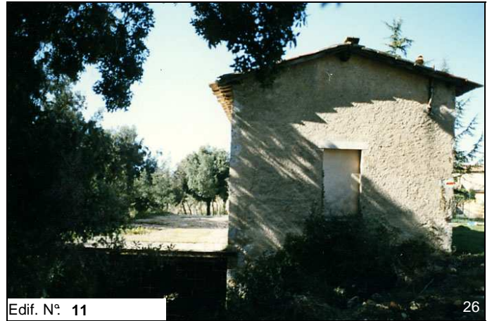
Edif. N° 11