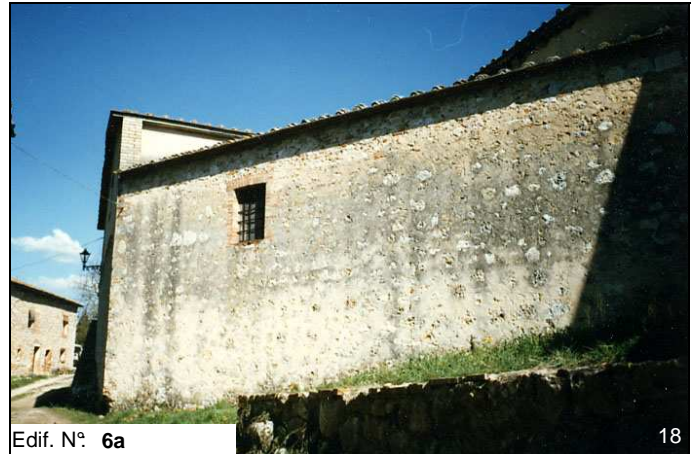
Edif. N° 6a