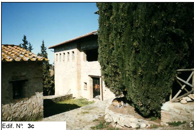
Edif. N° 3c