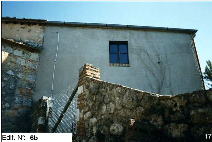
Edif. N° 6b