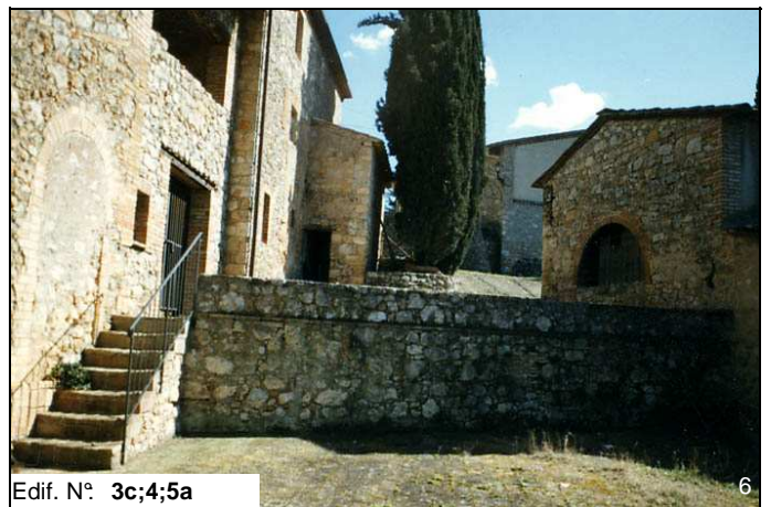
Edif. N° 3c;4;5a