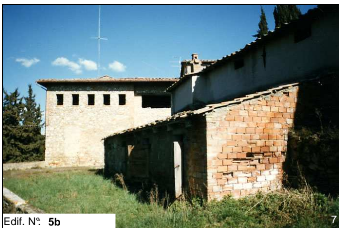
Edif. N° 5b