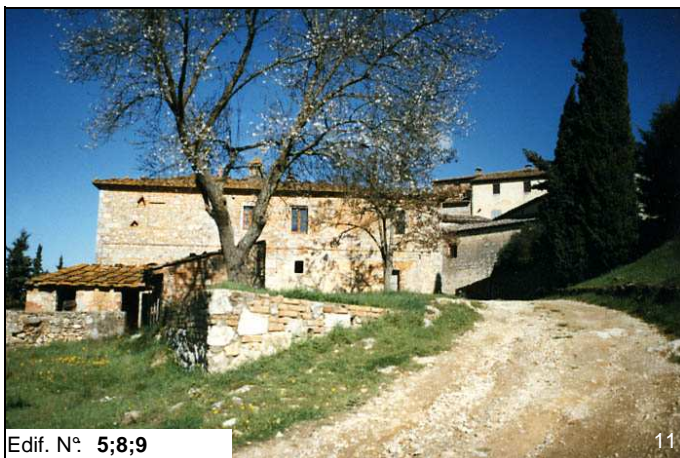
Edif. N° 5;8;9