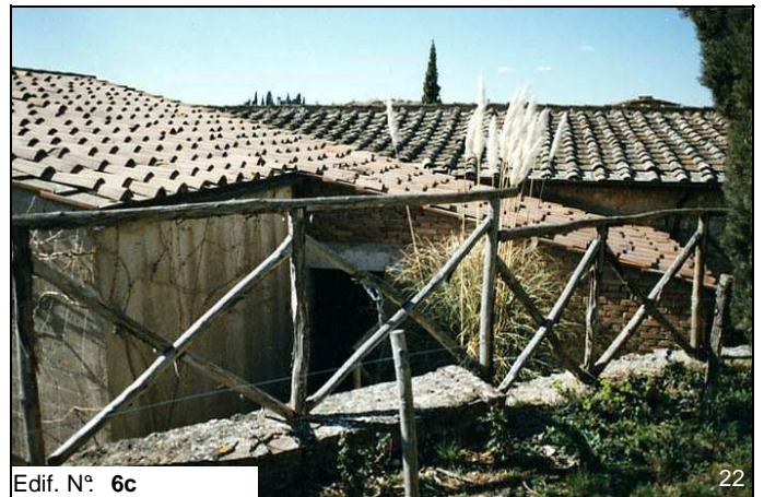
Edif. N° 6c