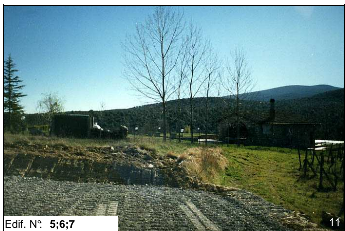
Edif. N° 5;6;7