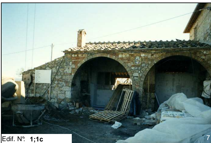
Edif. N° 1;1c