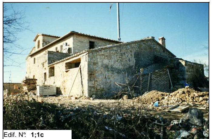
Edif. N° 1;1c