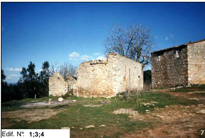
Edif. N° 1;3;4