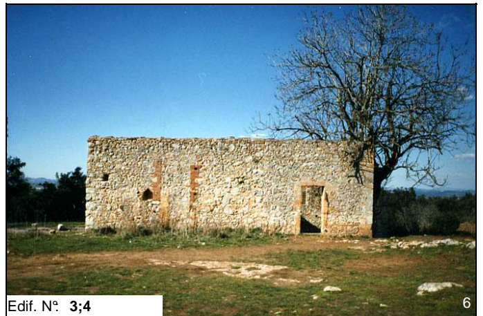
Edif. N° 3;4