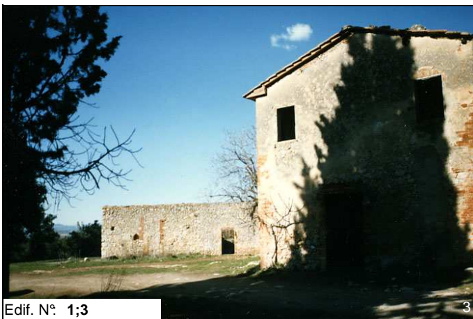
Edif. N° 1;3