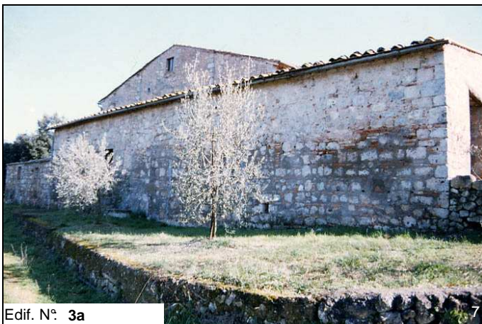
Edif. N° 3a