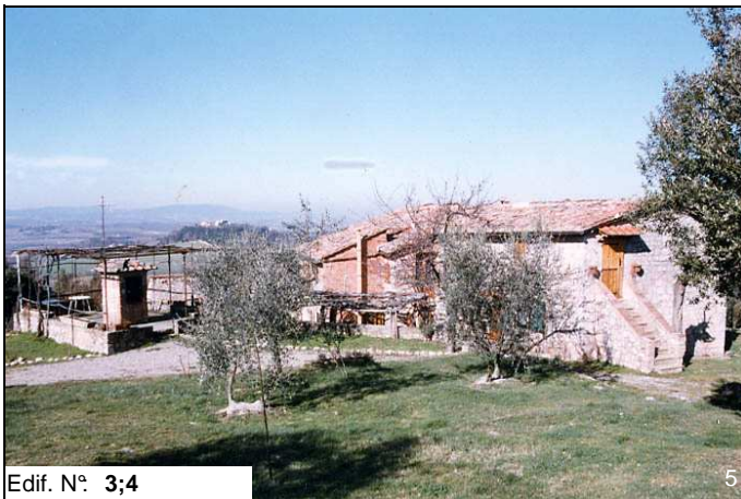
Edif. N° 3;4