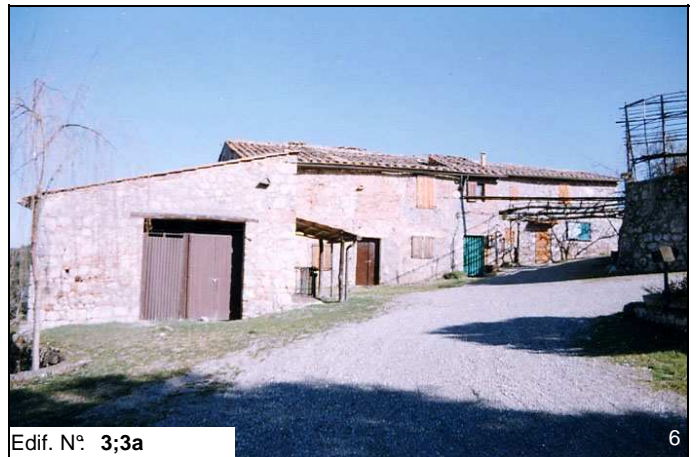
Edif. N° 3;3a