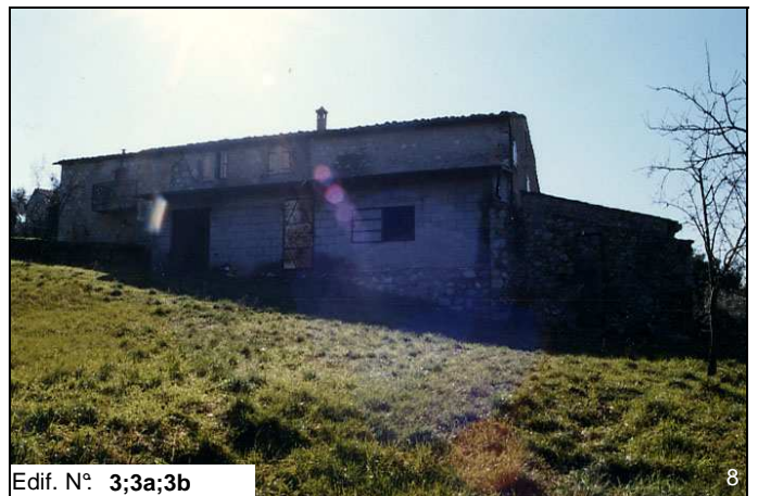
Edif. N° 3;3a;3b