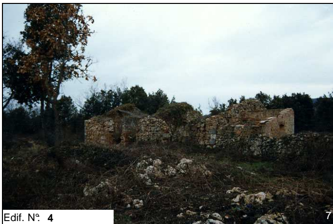
Edif. N° 4