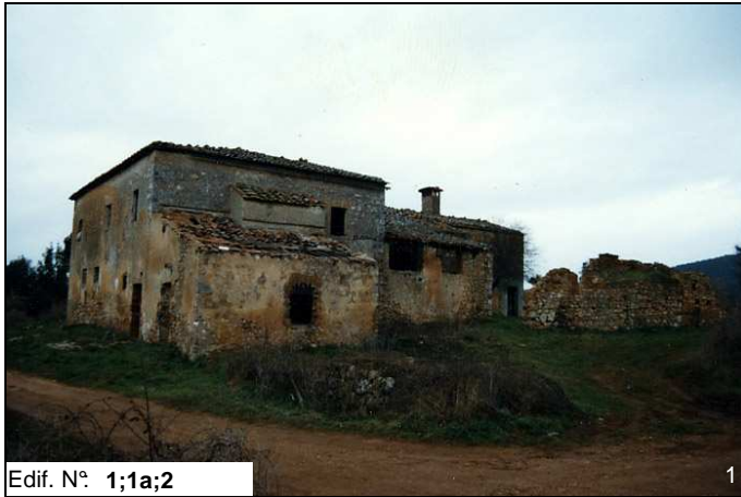
Edif. N° 1;1a;2