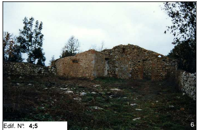
Edif. N° 4;5