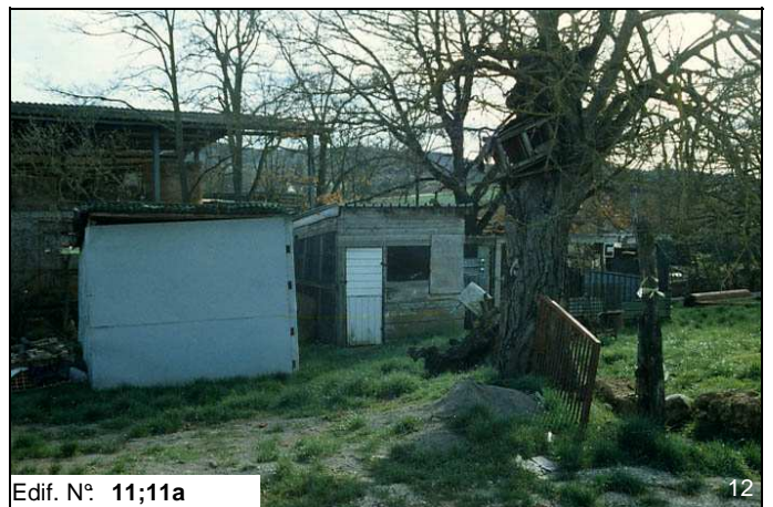
Edif. N° 11;11a