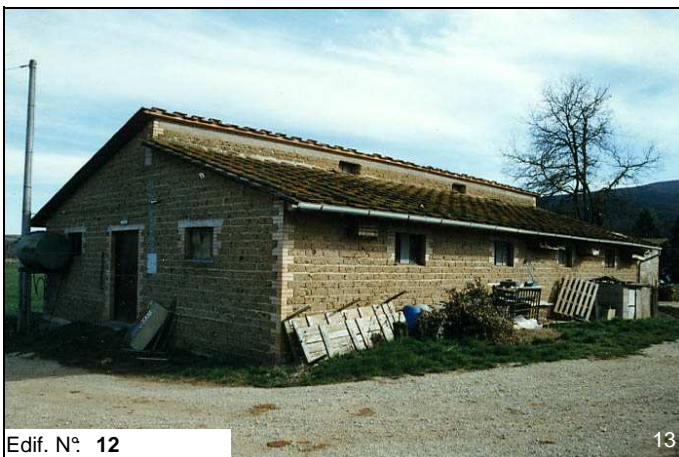
Edif. N° 12