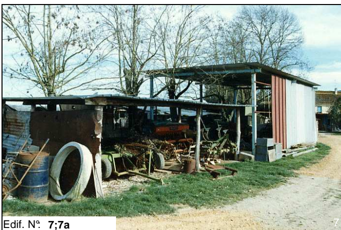
Edif. N° 7;7a