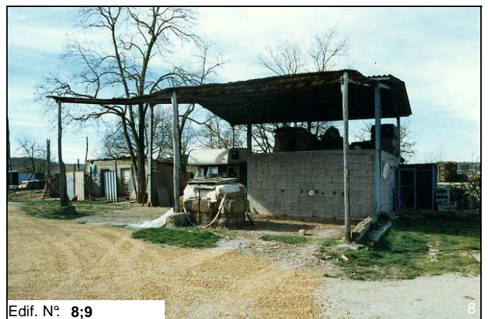
Edif. N° 8;9