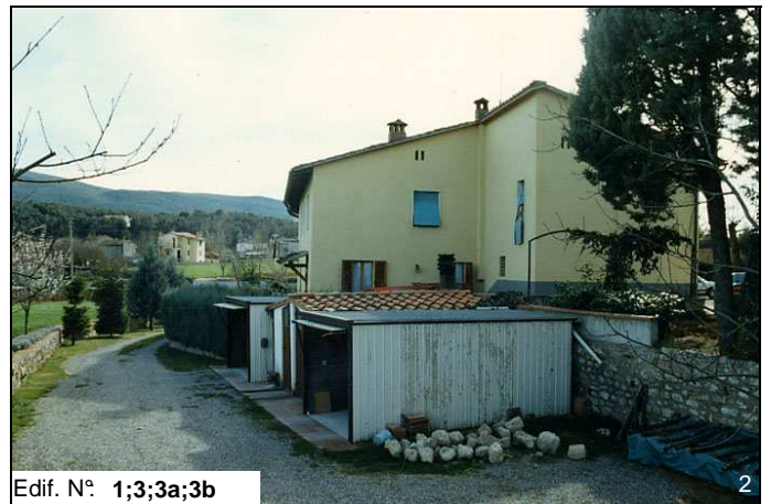
Edif. N° 1;3;3a;3b