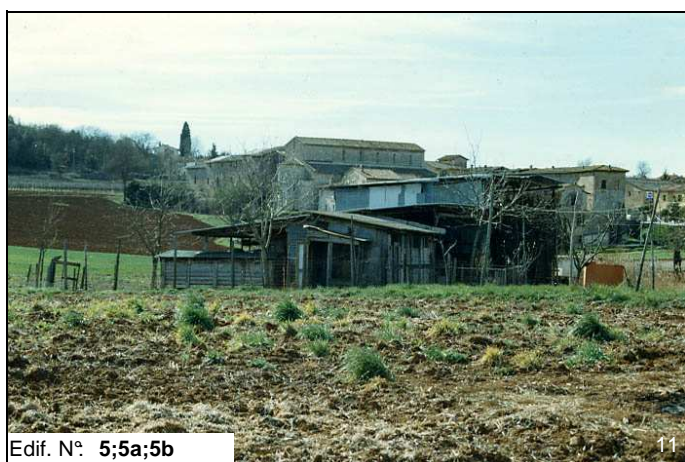
Edif. N° 5;5a;5b