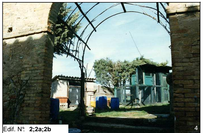
Edif. N° 2;2a;2b