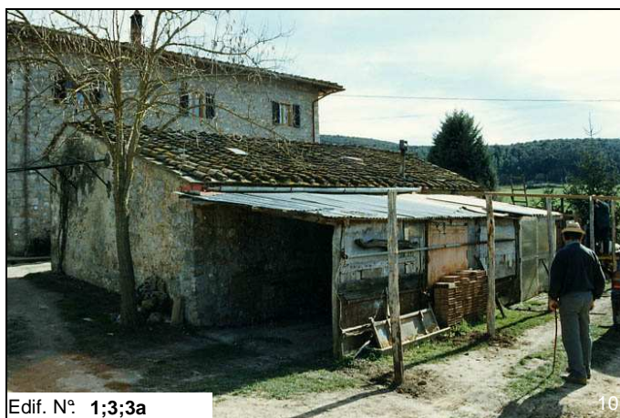
Edif. N° 1;3;3a