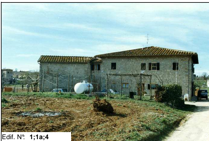
Edif. N° 1;1a;4