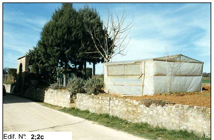
Edif. N° 2;2c