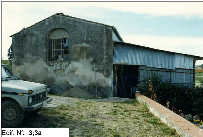
Edif. N° 3;3a