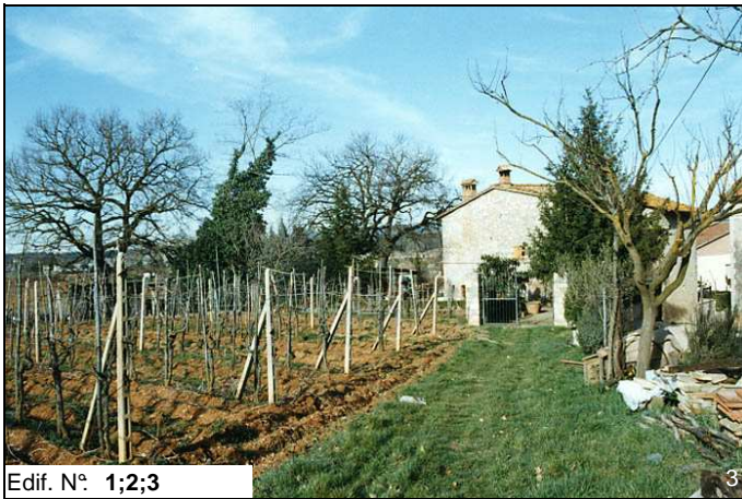
Edif. N° 1;2;3