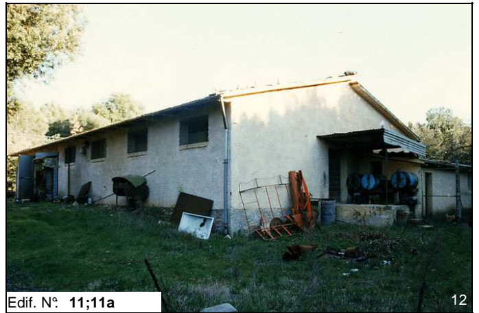
Edif. N° 11;11a