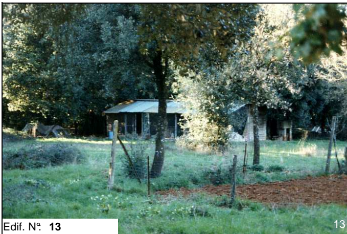
Edif. N° 13