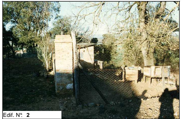
Edif. N° 2