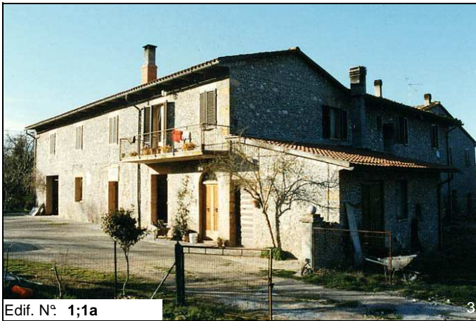
Edif. N° 1;1a