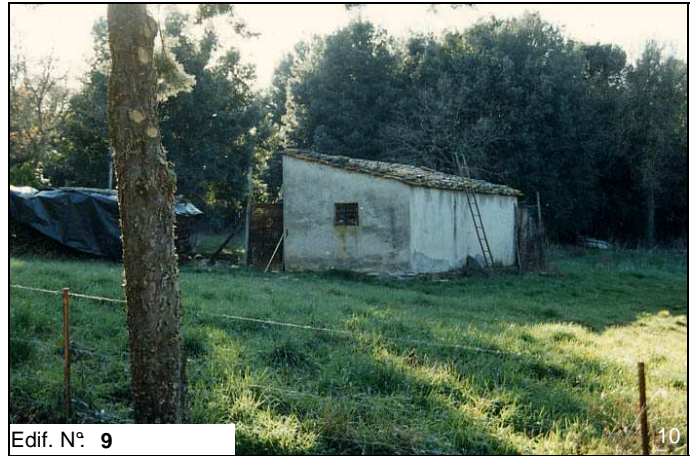
Edif. N° 9