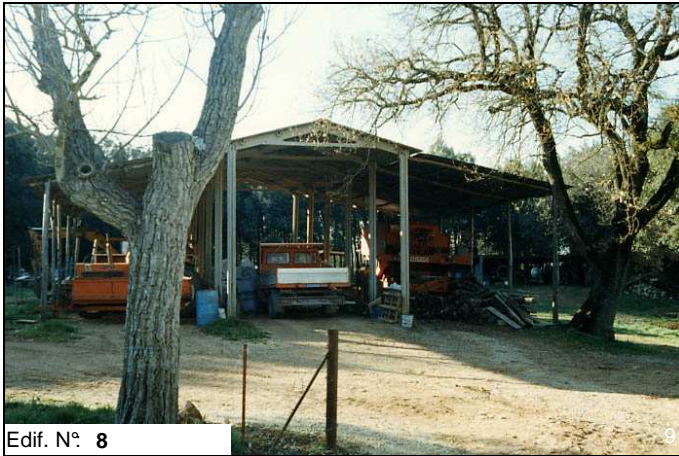
Edif. N° 8