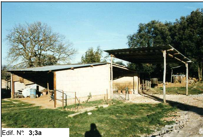
Edif. N° 3;3a