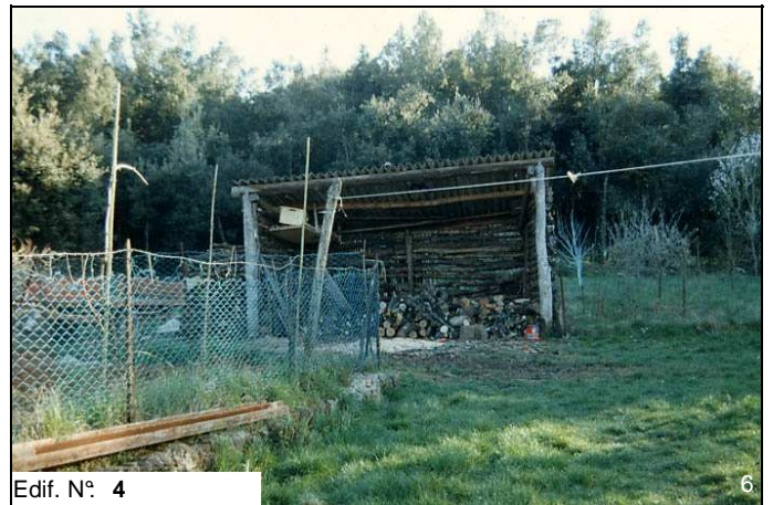
Edif. N° 4