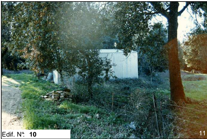
Edif. N° 10