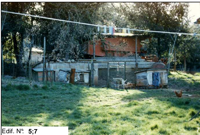
Edif. N° 5;7