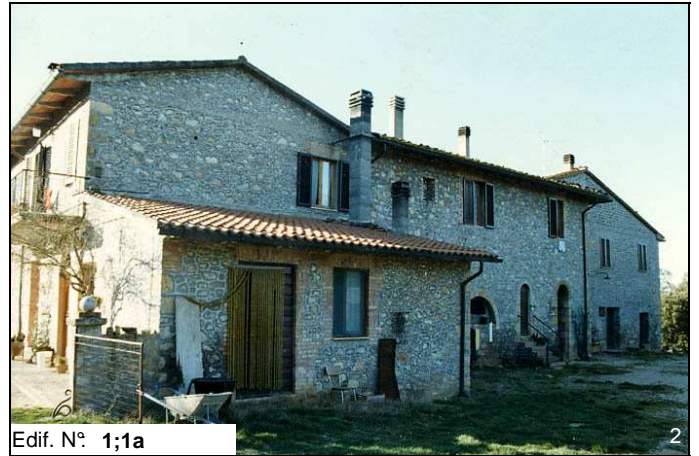
Edif. N° 1;1a