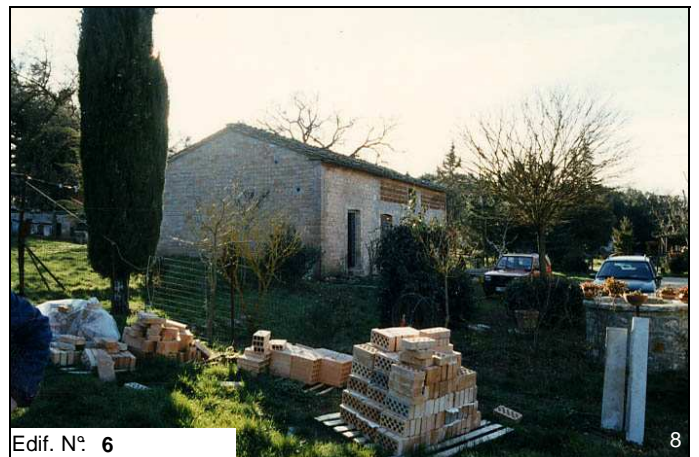
Edif. N° 6