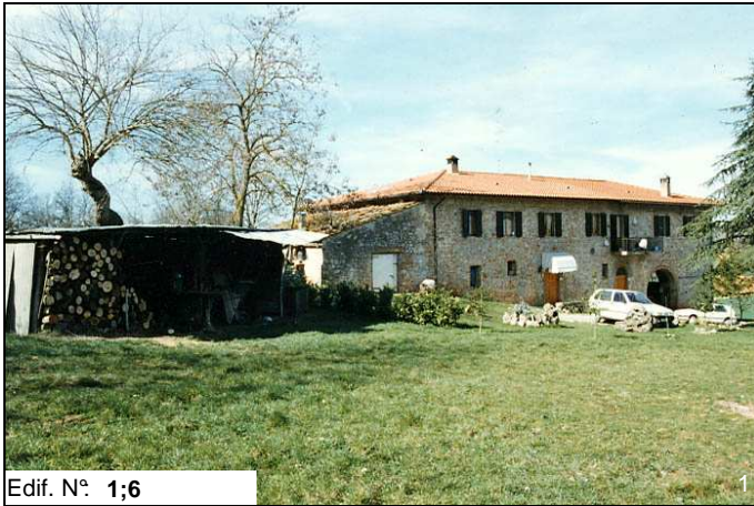
Edif. N° 1;6