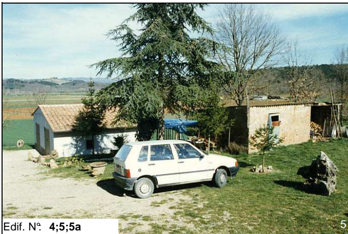
Edif. N° 4;5;5a