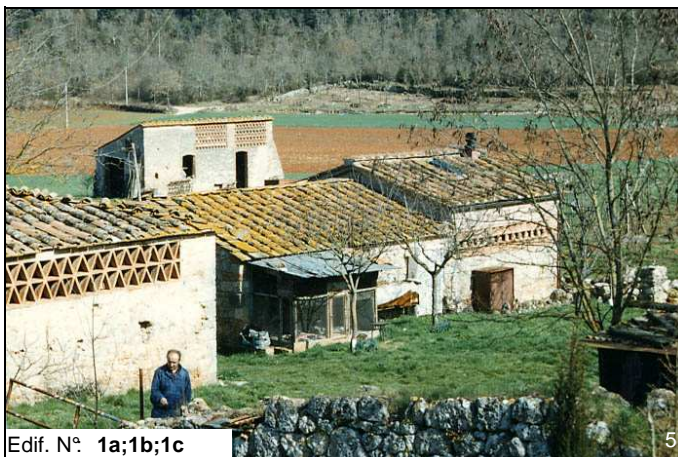
Edif. N° 1a;1b;1c