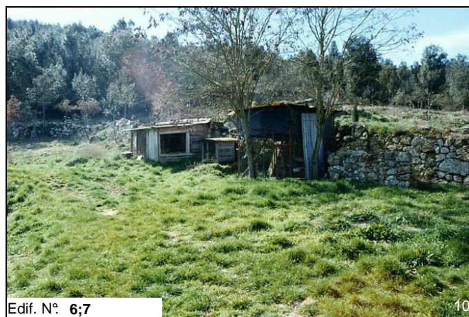
Edif. N° 6;7