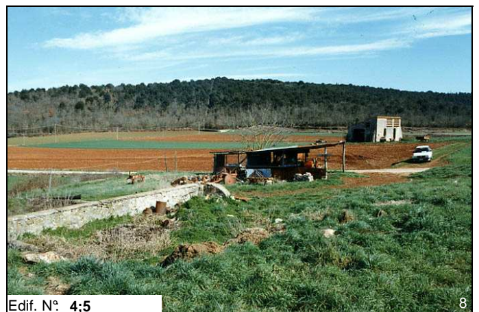
Edif. N° 4;5