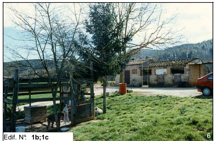
Edif. N° 1b;1c