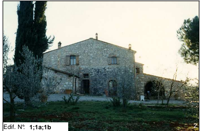
Edif. N° 1;1a;1b