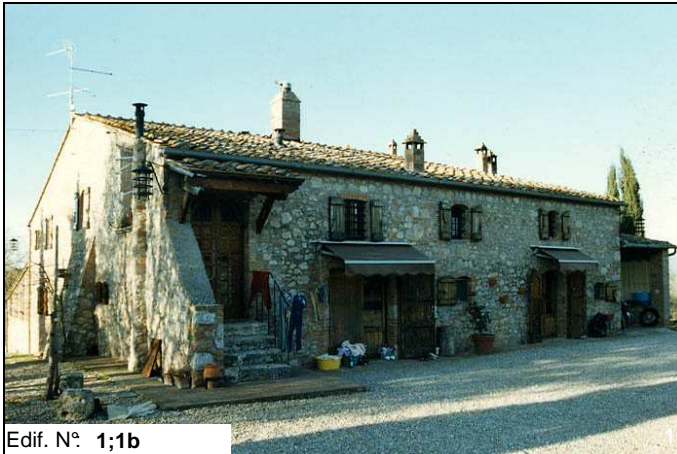
Edif. N° 1;1b