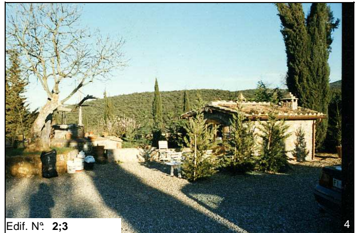
Edif. N° 2;3