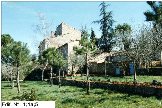
Edif. N° 1;1a;5