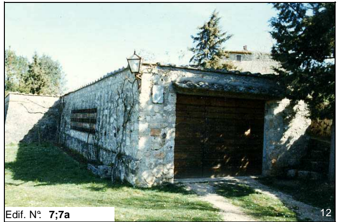
Edif. N° 7;7a