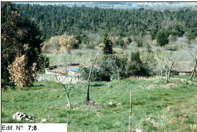
Edif. N° 7;8