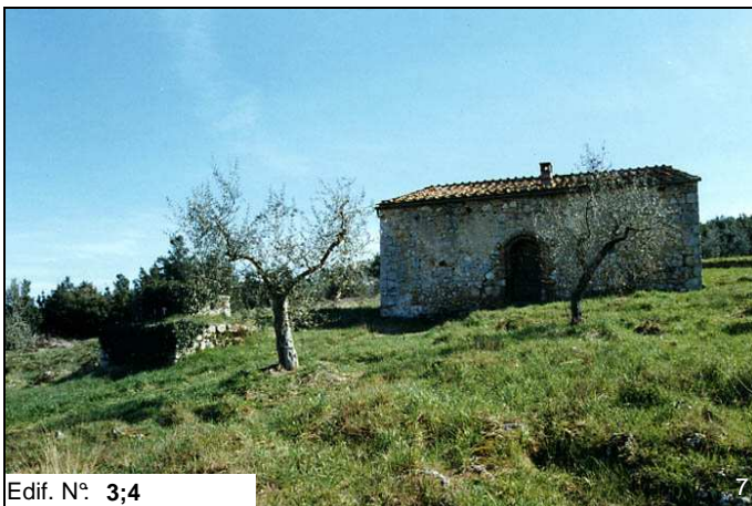
Edif. N° 3;4