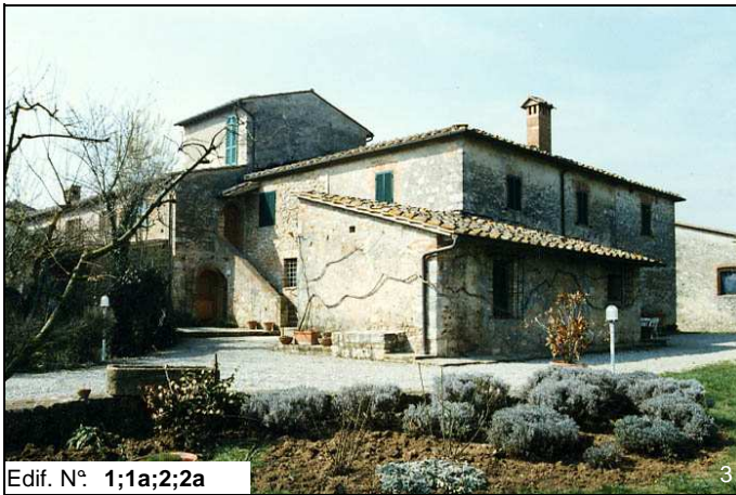
Edif. N° 1;1a;2;2a