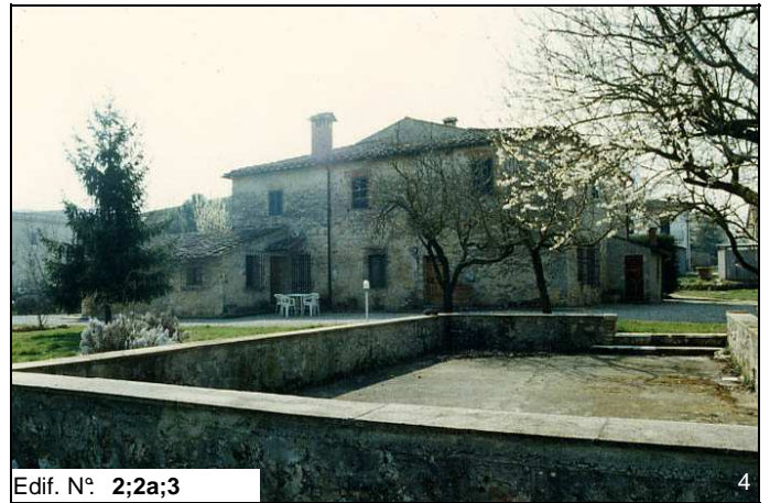
Edif. N° 2;2a;3