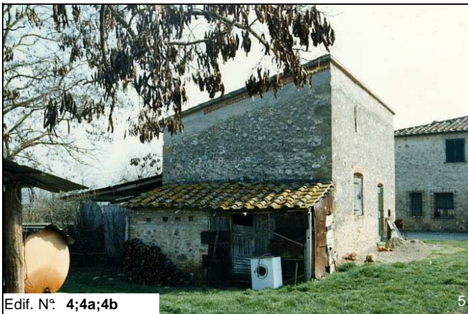
Edif. N° 4;4a;4b