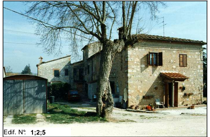
Edif. N° 1;2;5