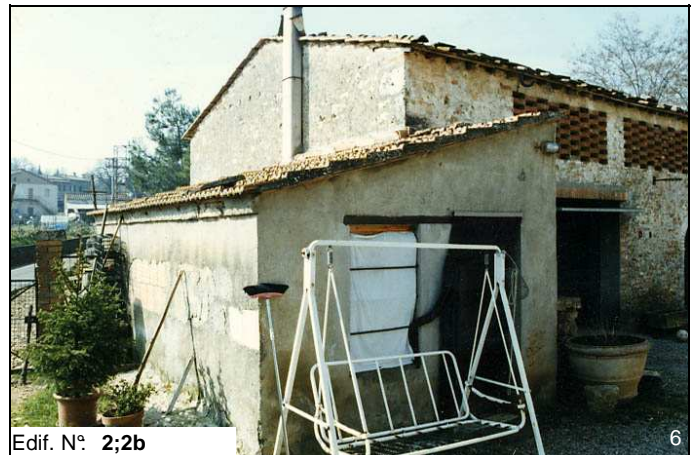
Edif. N° 2;2b