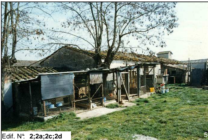
Edif. N° 2;2a;2c;2d