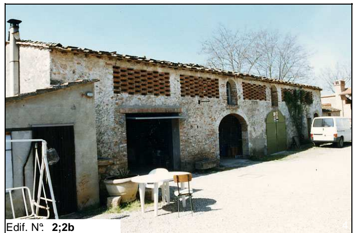
Edif. N° 2;2b