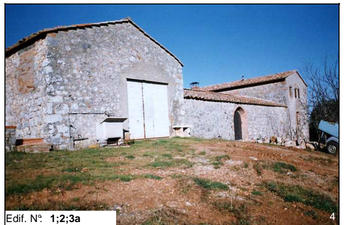
Edif. N° 1;2;3a