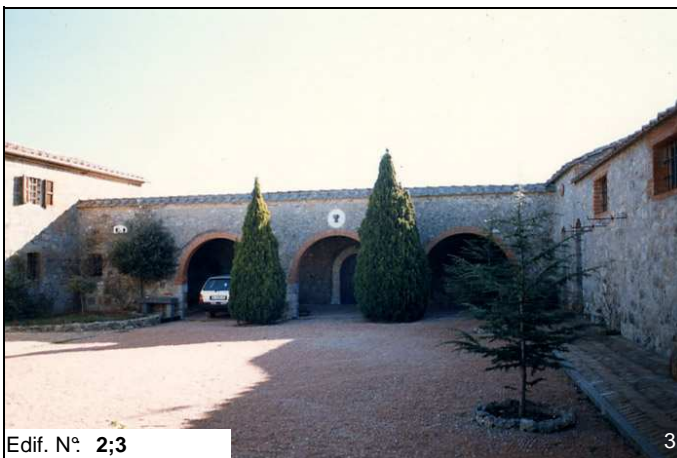
Edif. N° 2;3