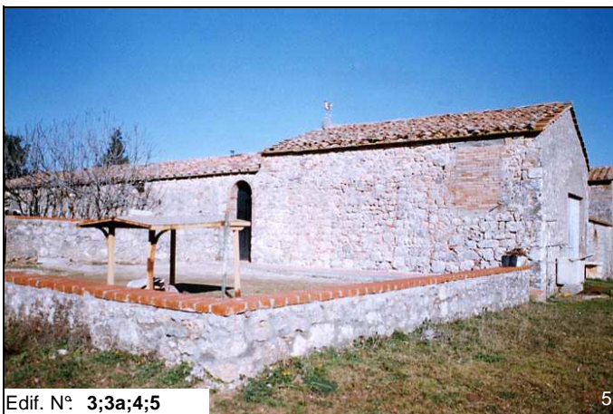
Edif. N° 3;3a;4;5