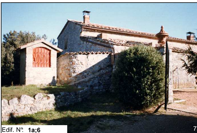
Edif. N° 1a;6