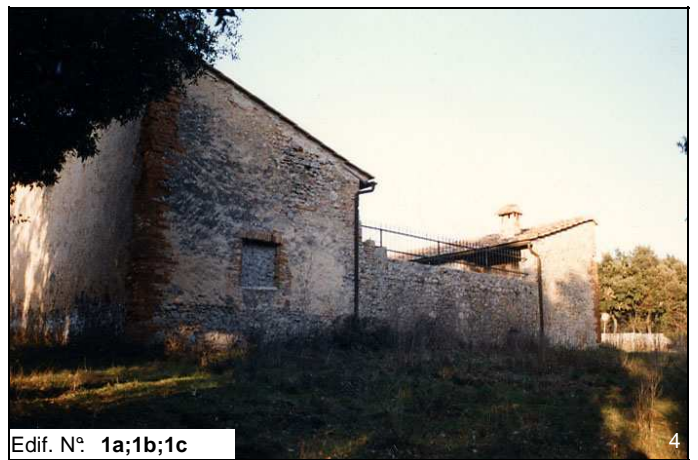
Edif. N° 1a;1b;1c