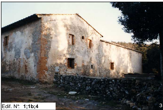
Edif. N° 1;1b;4