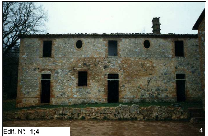
Edif. N° 1;4