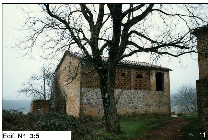
Edif. N° 3;5