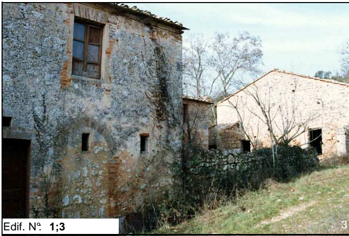
Edif. N° 1;3