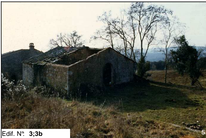
Edif. N° 3;3b