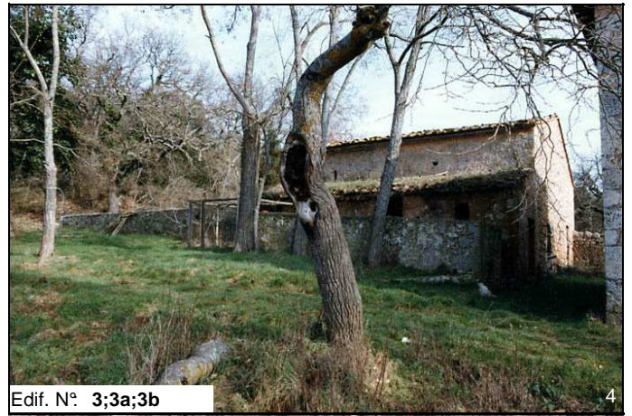
Edif. N° 3;3a;3b