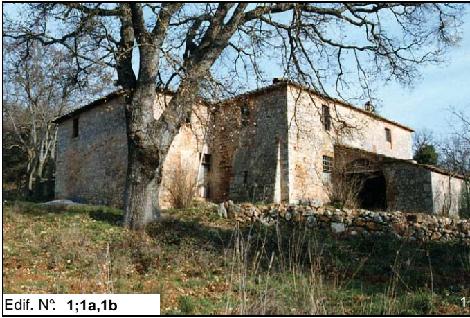
Edif. N° 1;1a,1b