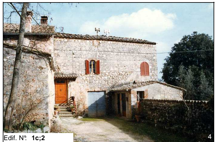
Edif. N° 1c;2