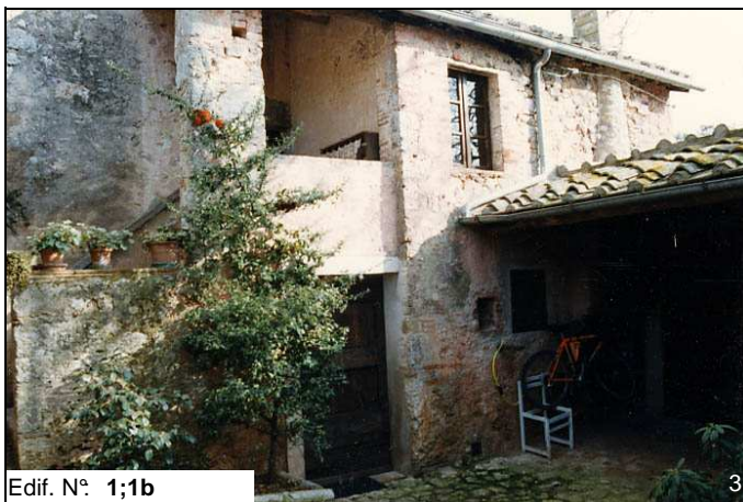
Edif. N° 1;1b