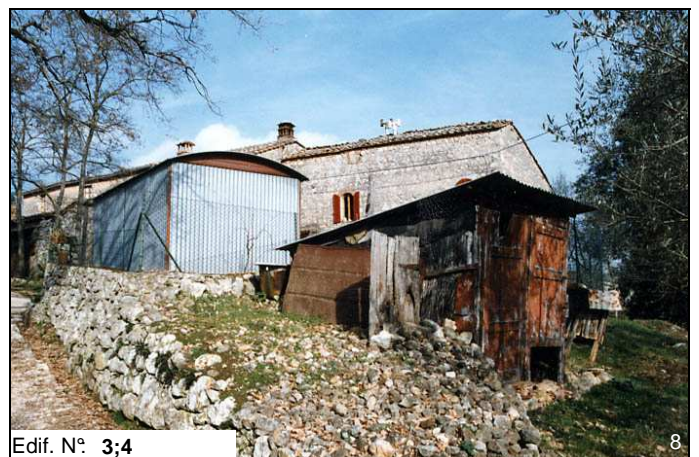
Edif. N° 3;4