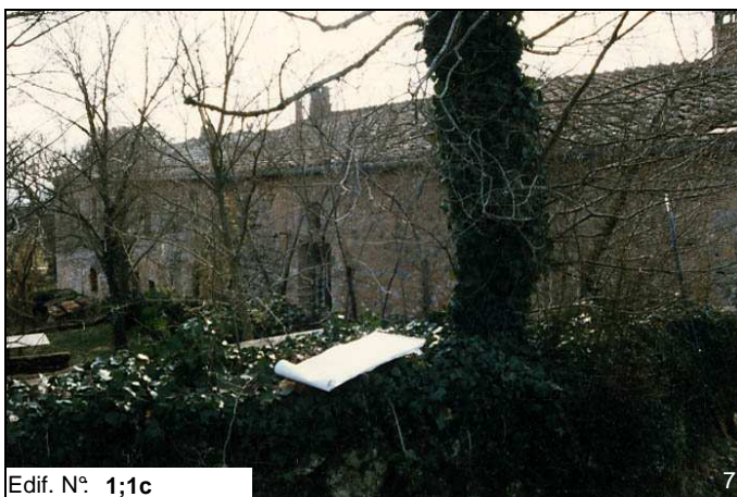
Edif. N° 1;1c