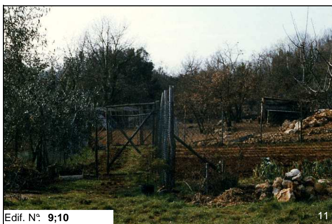
Edif. N° 9;10