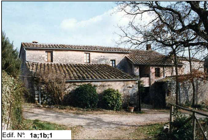
Edif. N° 1a;1b;1