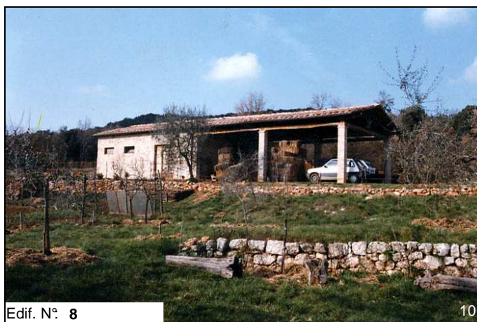
Edif. N° 8