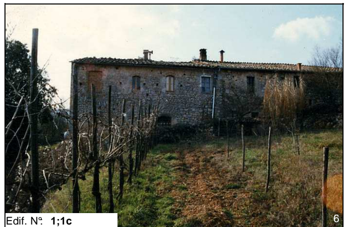
Edif. N° 1;1c