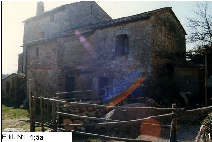
Edif. N° 1;5a