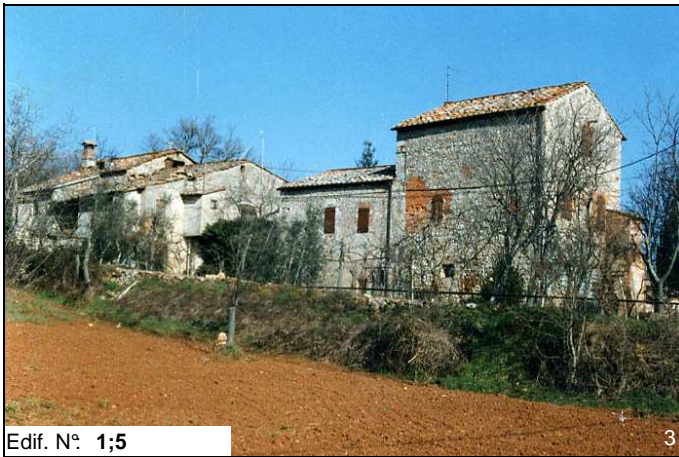
Edif. N° 1;5