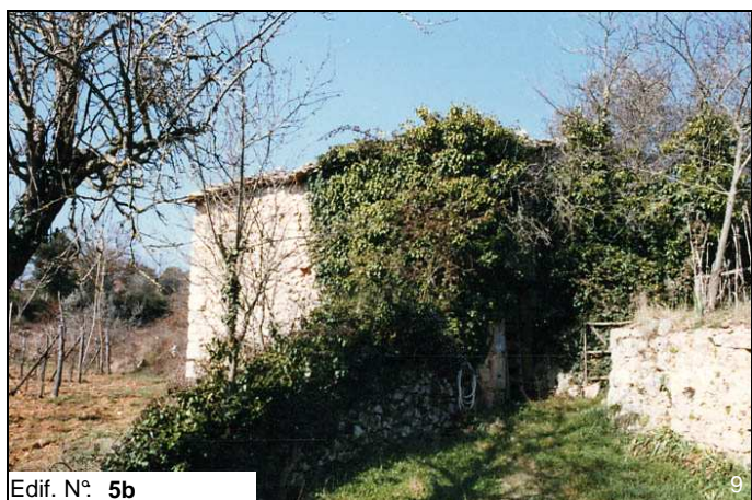
Edif. N° 5b