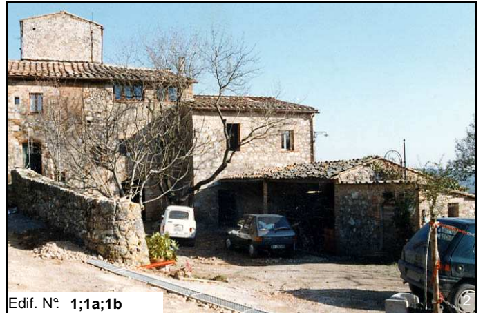
Edif. N° 1;1a;1b