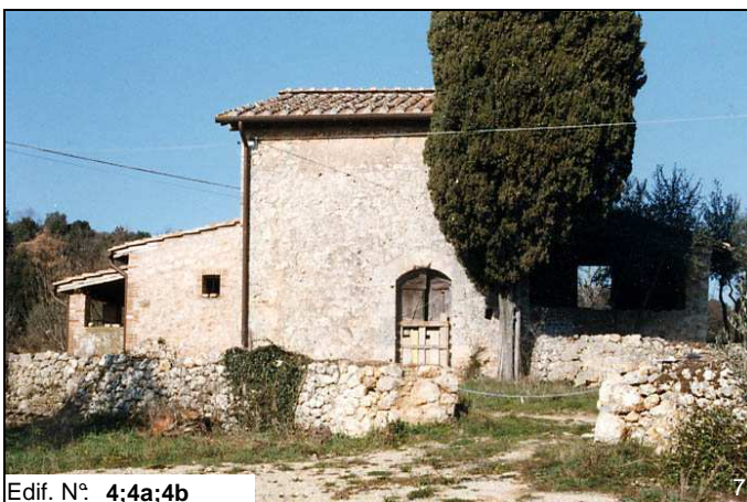
Edif. N° 4;4a;4b