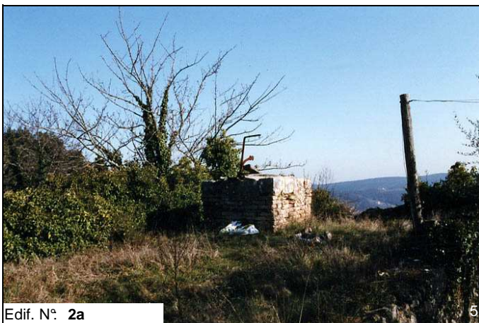
Edif. N° 2a