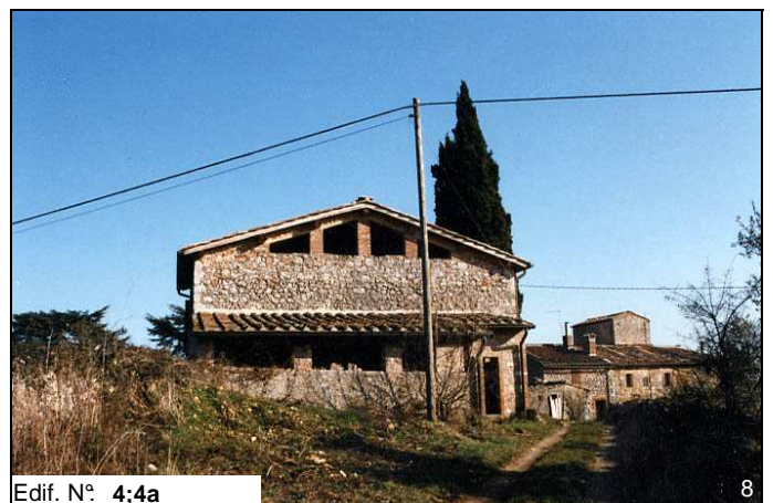
Edif. N° 4;4a