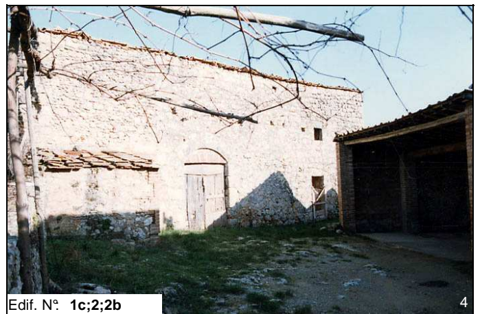
Edif. N° 1c;2;b