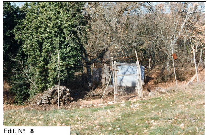
Edif. N° 8