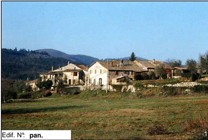
Edif. N° pan.