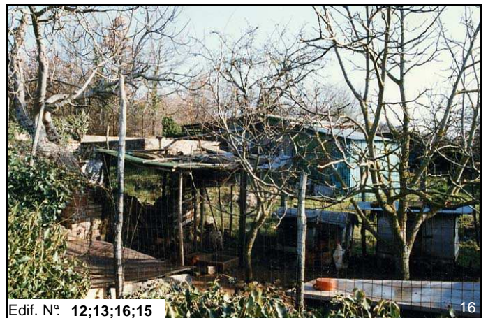
Edif. N° 12;13;16;15