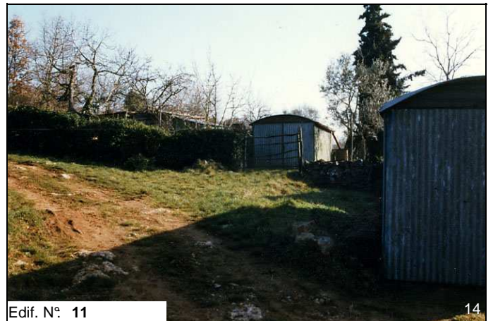
Edif. N° 11