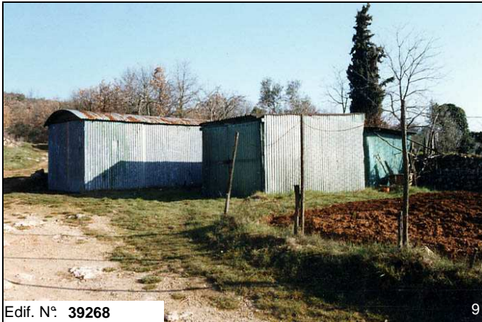
Edif. N° 39268