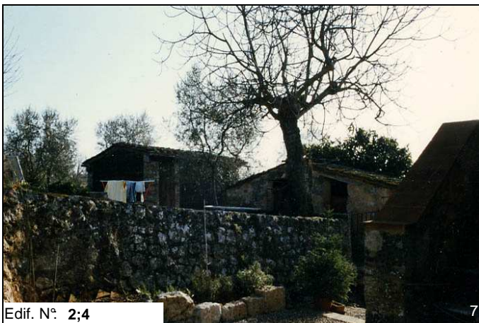
Edif. N° 2;4