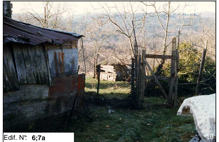
Edif. N° 6;7a