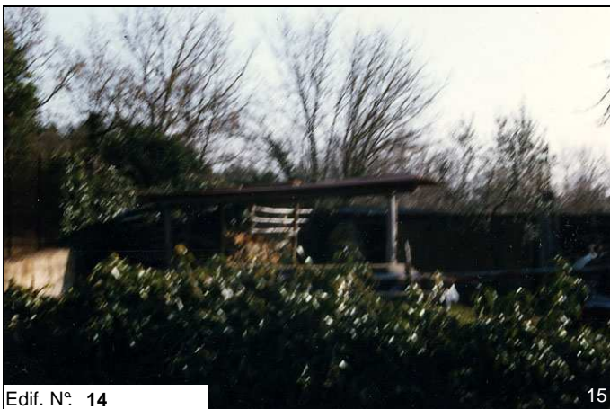
Edif. N° 14