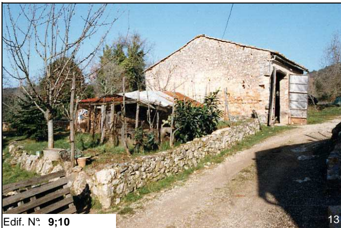
Edif. N° 9;10