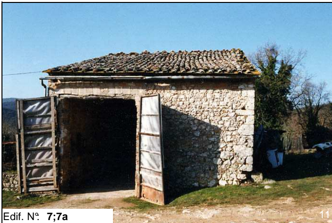
Edif. N° 7;7a