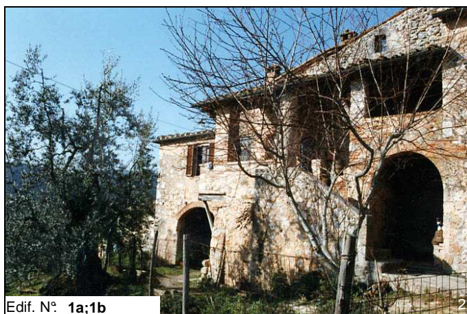
Edif. N° 1a;1b