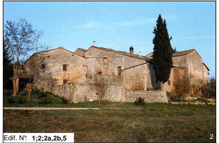
Edif. N° 1;2;2a,2b,5