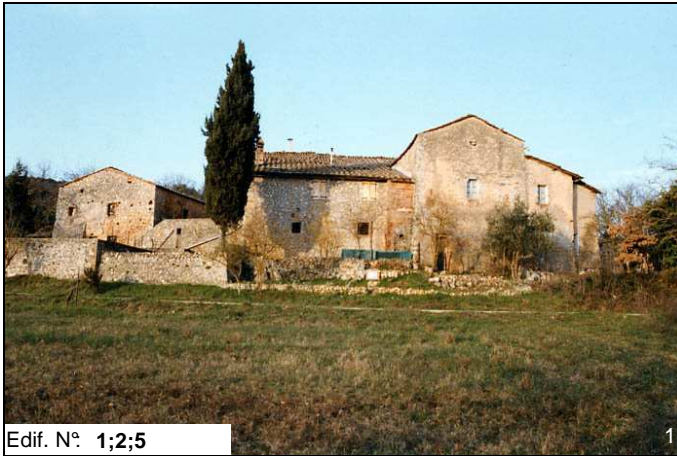
Edif. N° 1;2;5