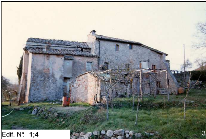
Edif. N° 1;4