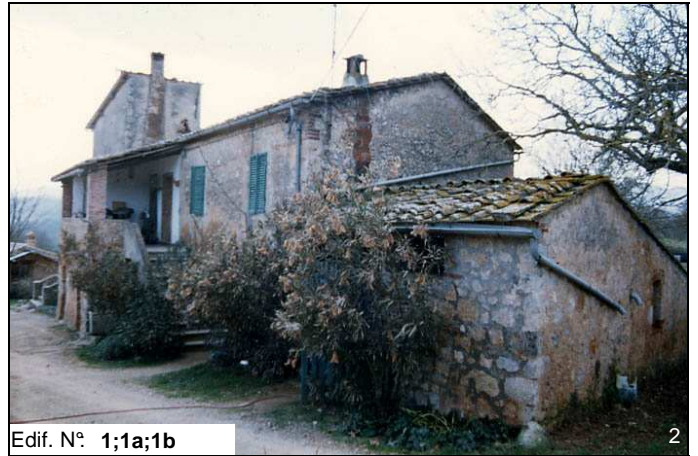
Edif. N° 1;1a;1b