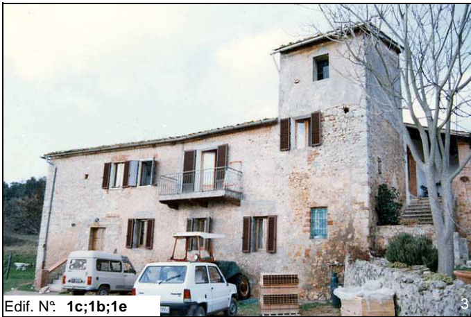
Edif. N° 1c;1b;1e