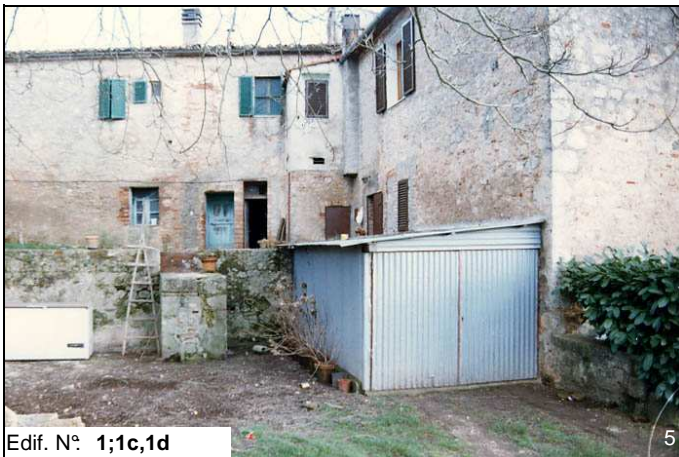
Edif. N° 1;1c,1d