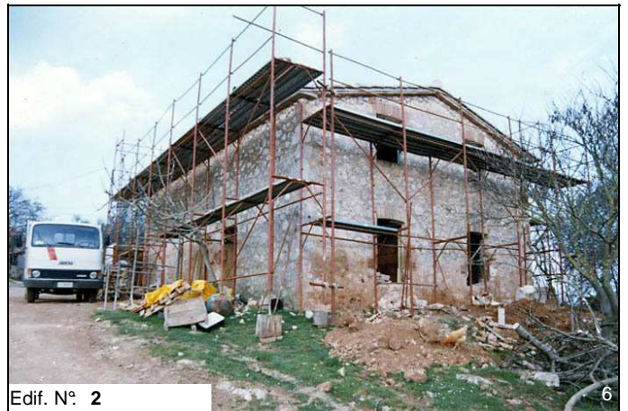
Edif. N° 2