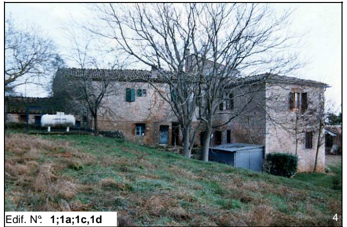
Edif. N° 1;1a;1c,1d