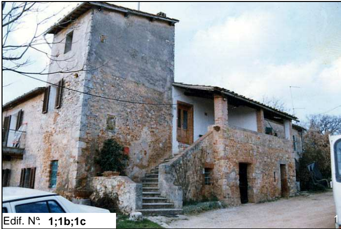
Edif. N° 1;1b;1c