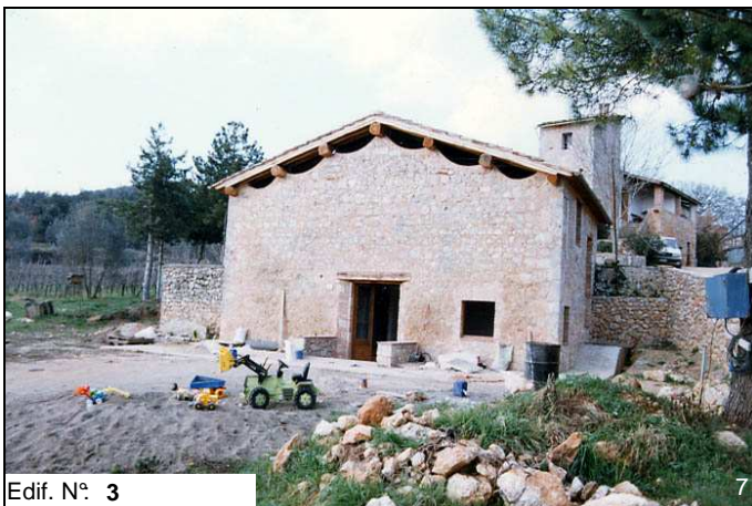
Edif. N° 3