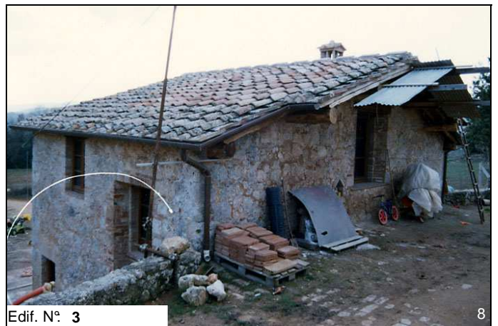
Edif. N° 3