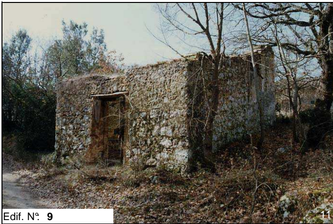
Edif. N° 9