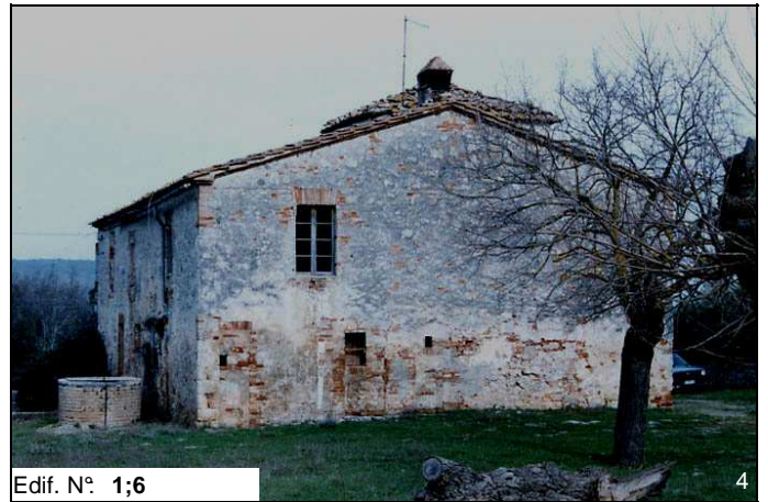
Edif. N° 1;6