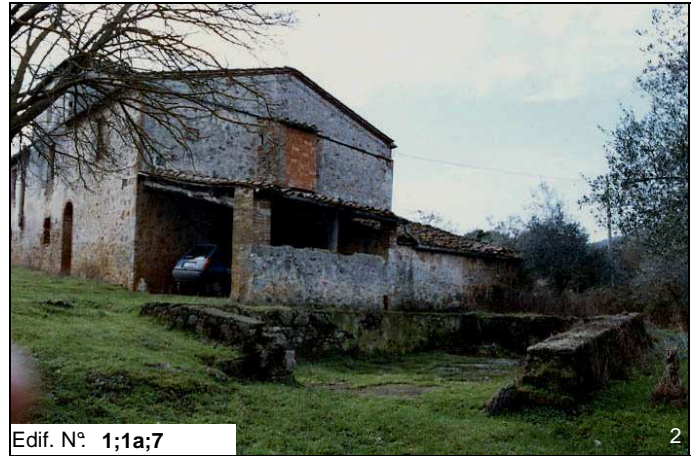
Edif. N° 1;1a;7