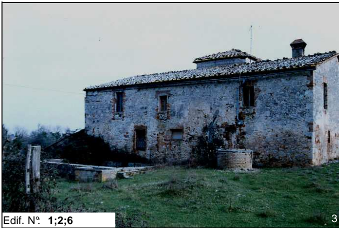
Edif. N° 1;2;6