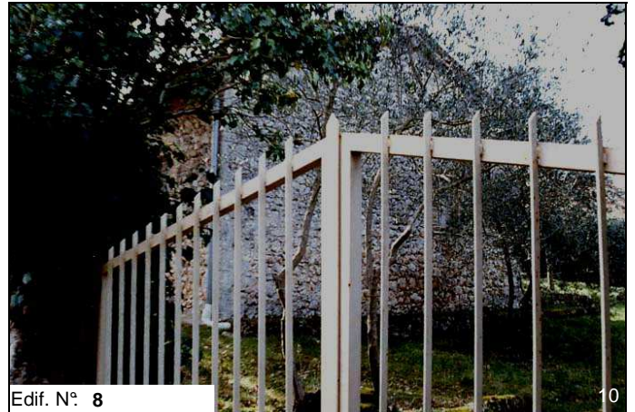
Edif. N° 8