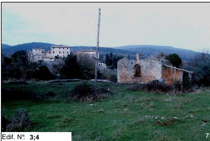
Edif. N° 3;4