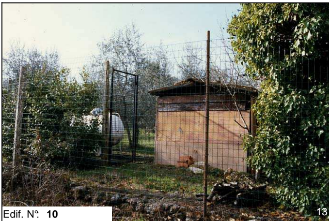
Edif. N° 10