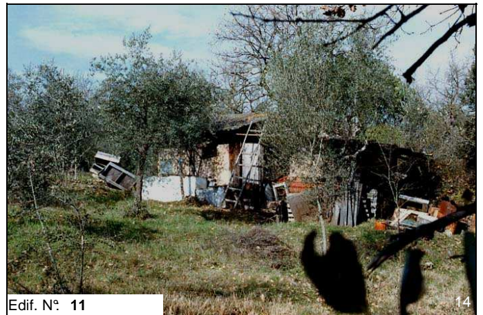
Edif. N° 11