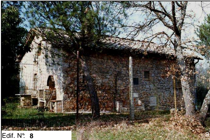
Edif. N° 8