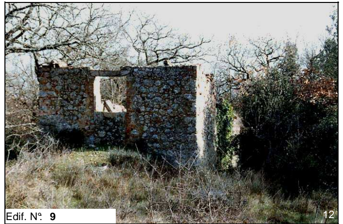
Edif. N° 9