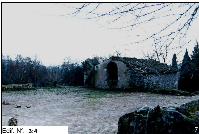
Edif. N° 3;4