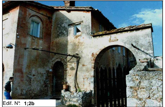
Edif. N° 1;2b