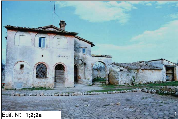
Edif. N° 1;2;2a