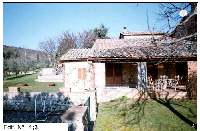
Edif. N° 1;3