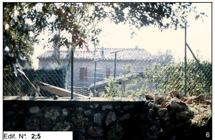
Edif. N° 2;5