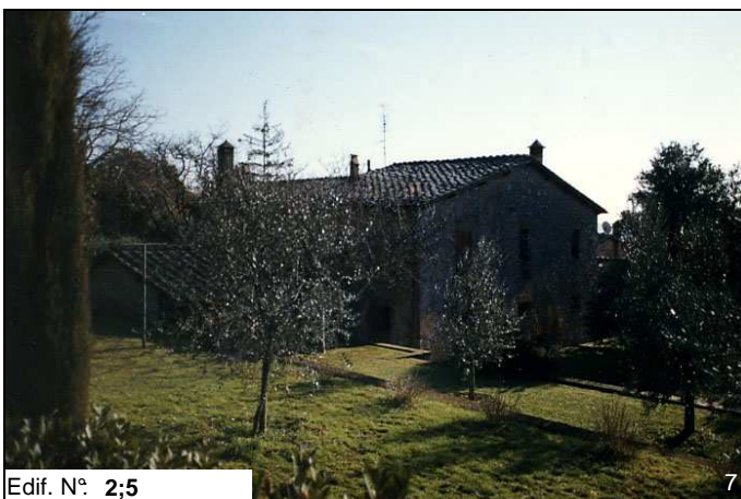
Edif. N° 2;5