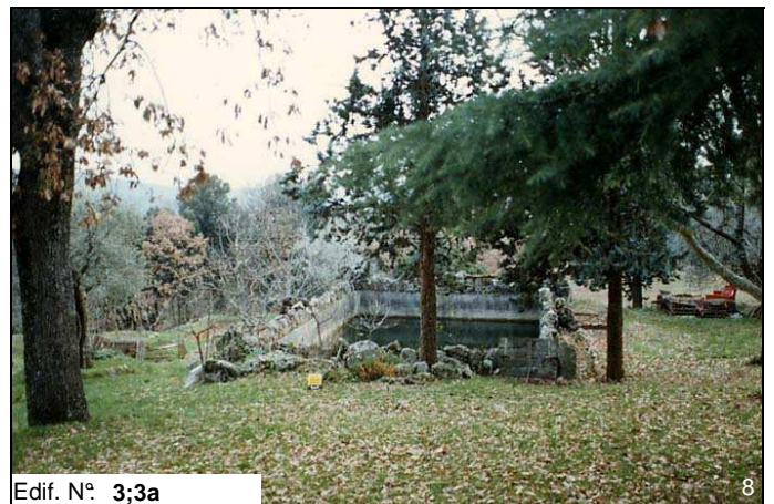
Edif. N° 3;3a