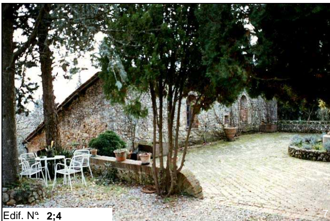
Edif. N° 2;4