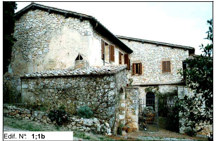
Edif. N° 1;1b