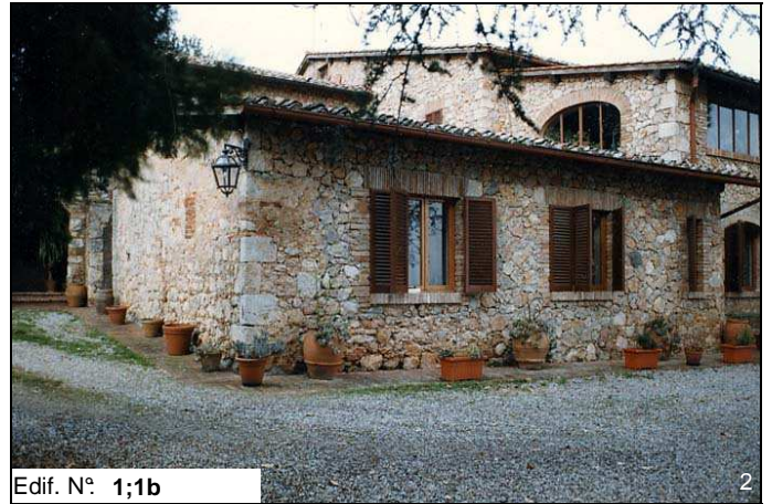
Edif. N° 1;1b