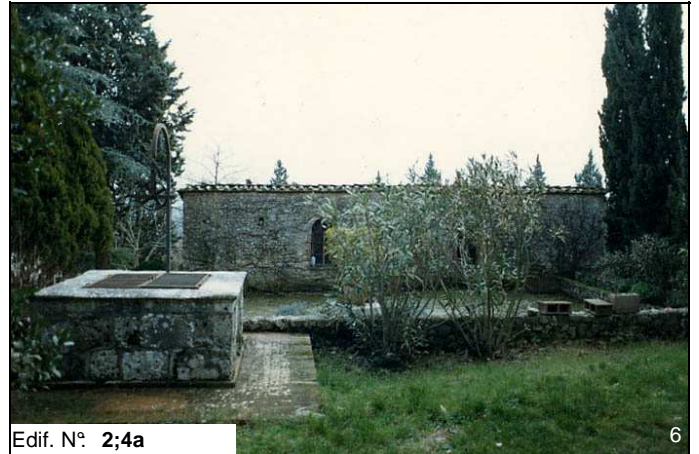
Edif. N° 2;4a