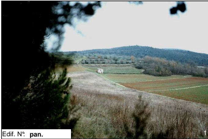
Edif. N° pan.