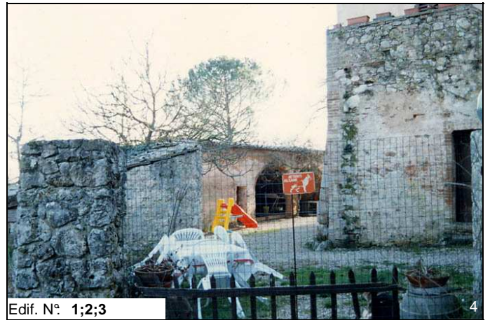
Edif. N° 1;2;3