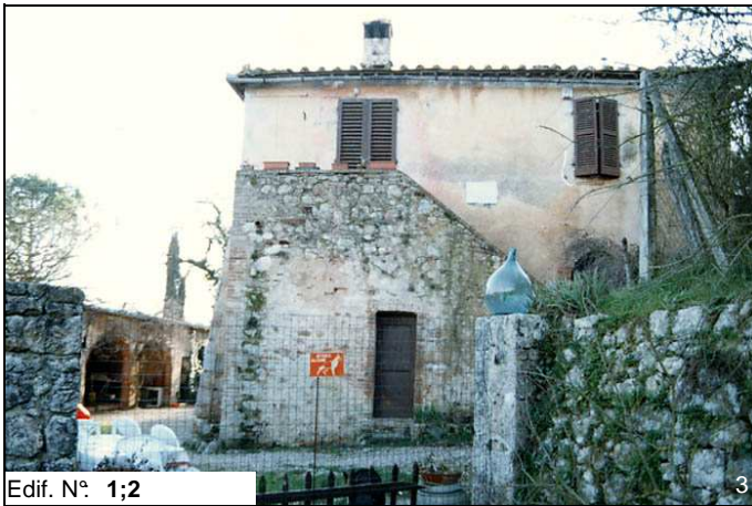
Edif. N° 1;2