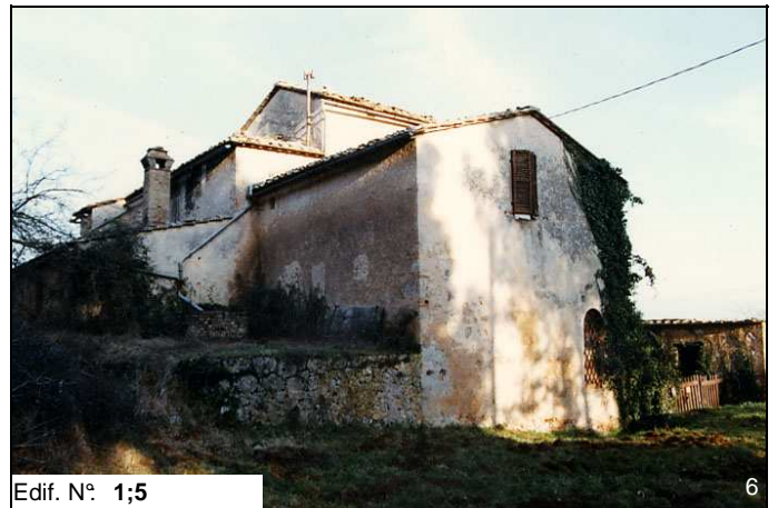
Edif. N° 1;5