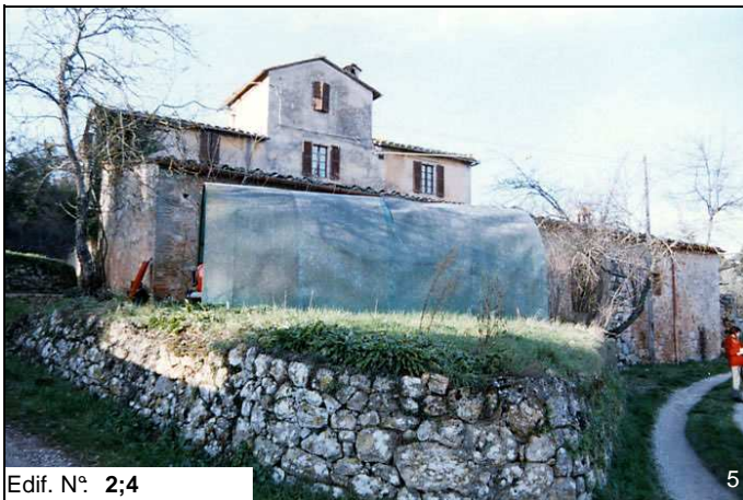
Edif. N° 2;4