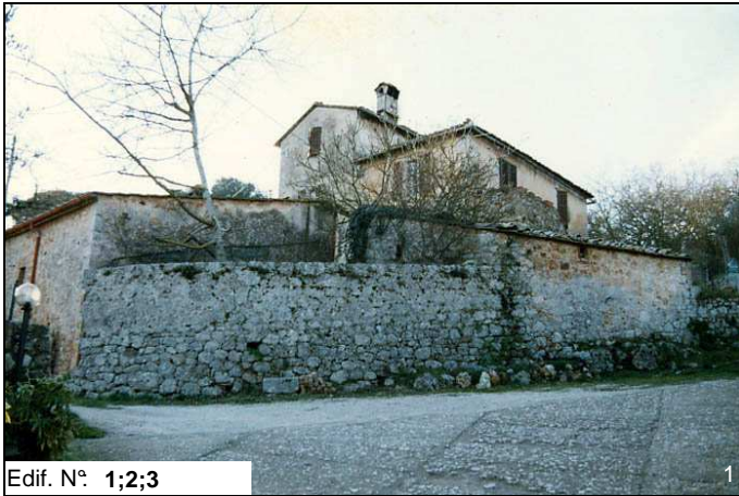
Edif. N° 1;2;3