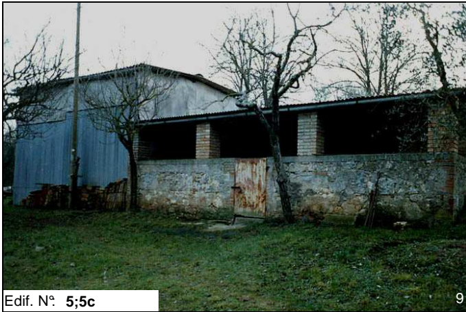
Edif. N° 5;5c