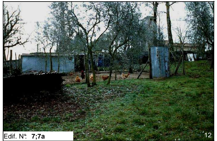
Edif. N° 7;7a