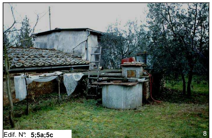
Edif. N° 5;5a;5c