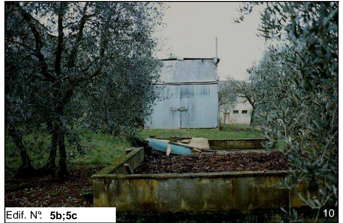
Edif. N° 5b;5c