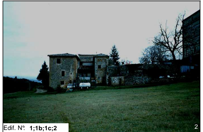
Edif. N° 1;1b;1c;2