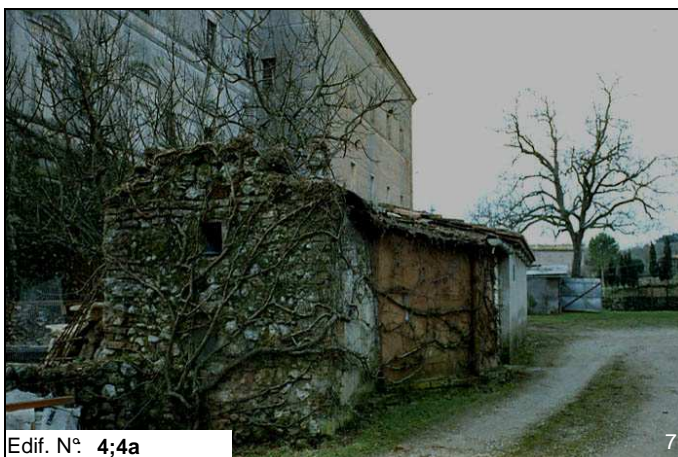
Edif. N° 4;4a