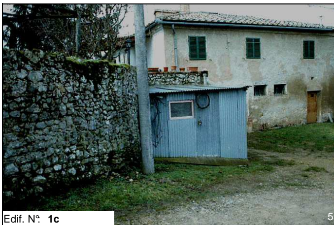
Edif. N° 1c