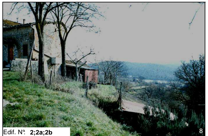
Edif. N° 2;2a;2b