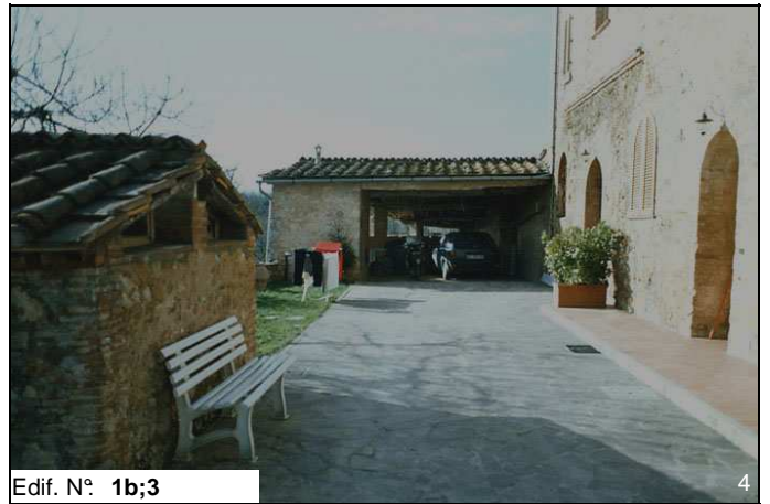
Edif. N° 1b;3