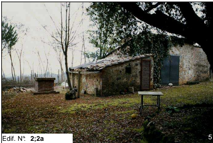
Edif. N° 2;2a