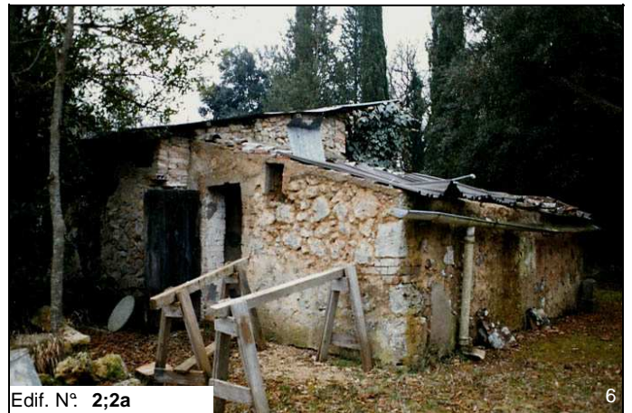
Edif. N° 2;2a