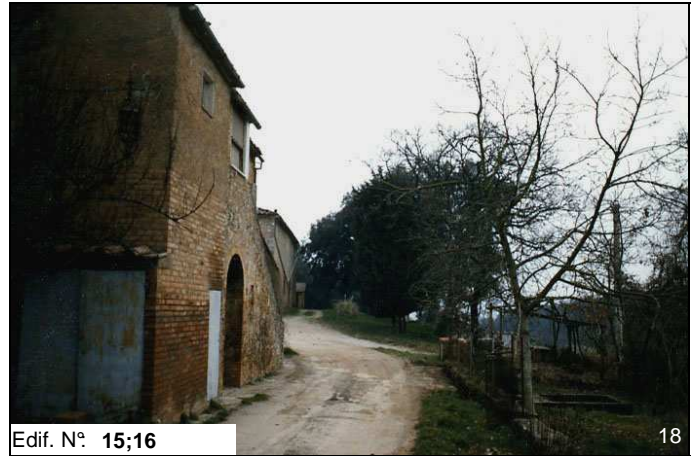
Edif. N° 15;16