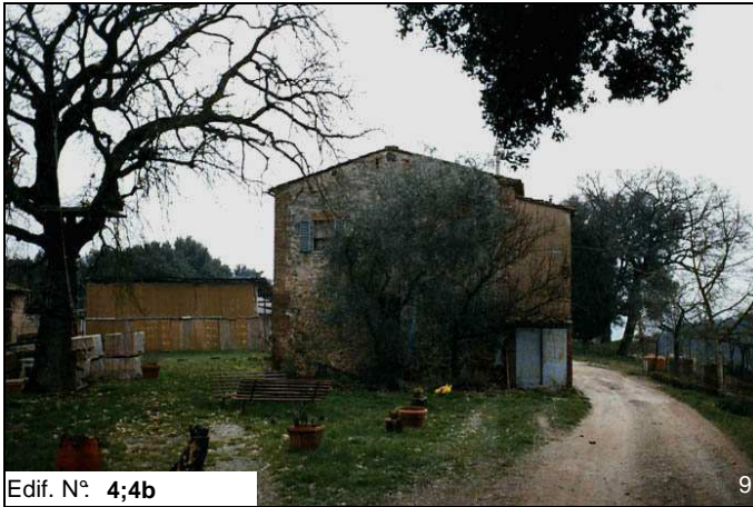
Edif. N° 4;4b