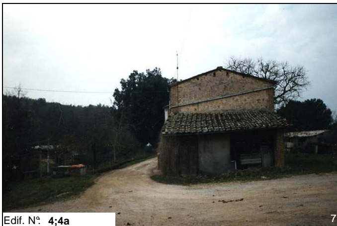
Edif. N° 4;4a