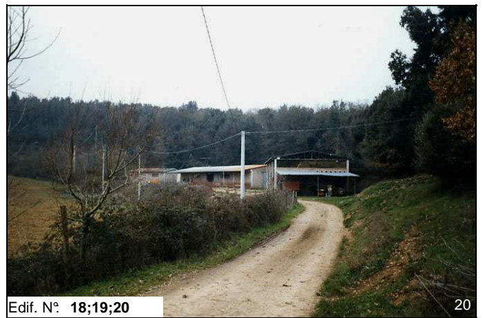
Edif. N° 18;19;20