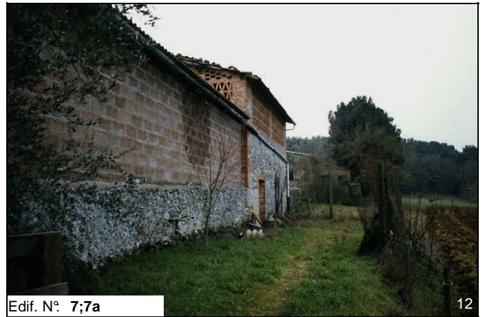
Edif. N° 7;7a