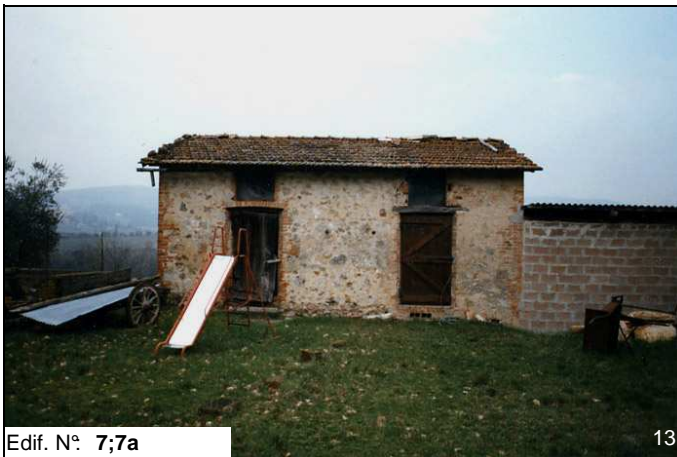
Edif. N° 7;7a