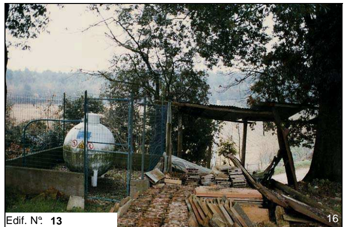
Edif. N° 13