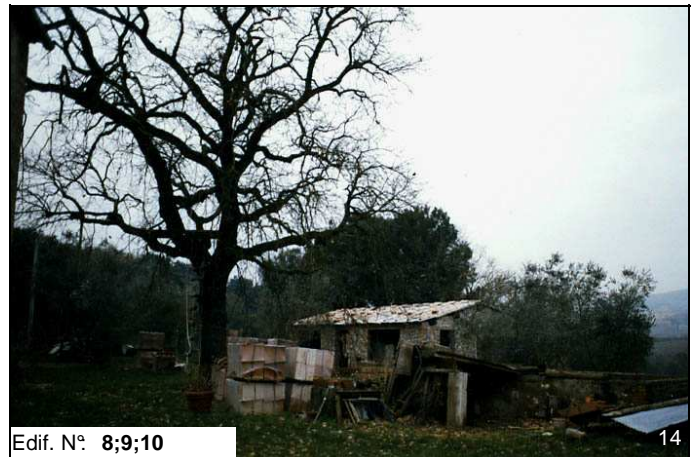
Edif. N° 8;9;10