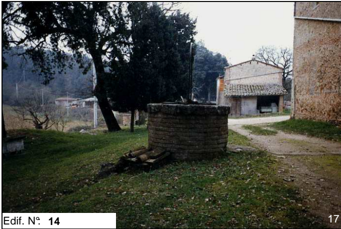
Edif. N° 14