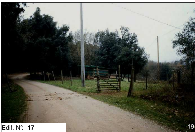
Edif. N° 17