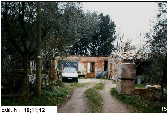
Edif. N° 10;11;12