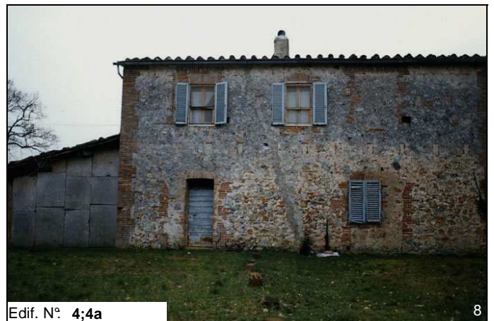
Edif. N° 4;4a