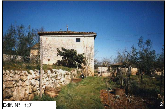
Edif. N° 1;7