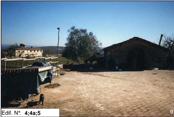
Edif. N° 4;4a;5