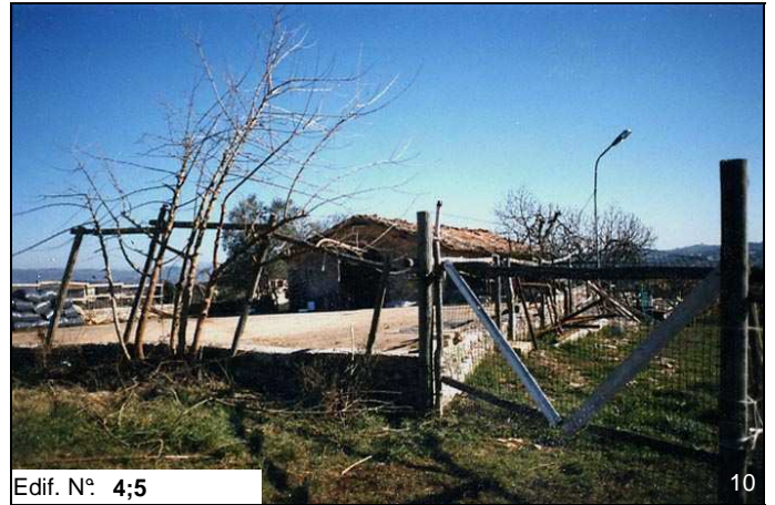
Edif. N° 4;5