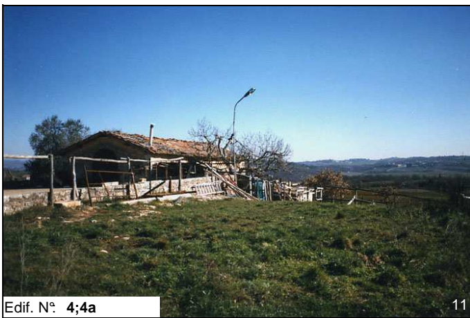
Edif. N° 4;4a