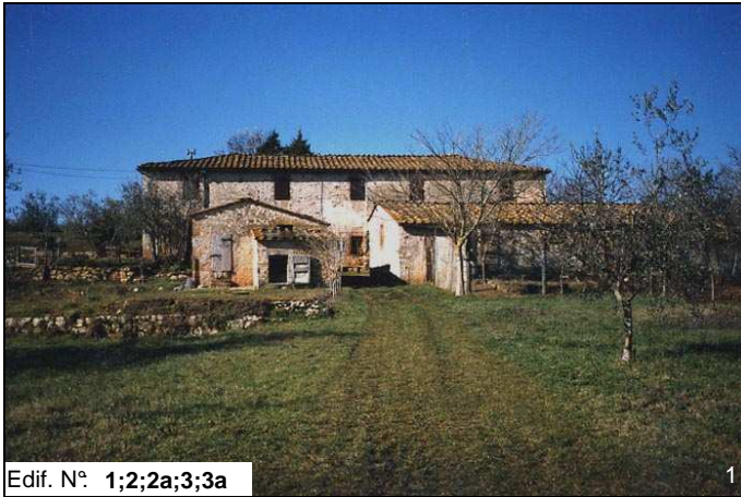
Edif. N° 1;2;2a;3;3a