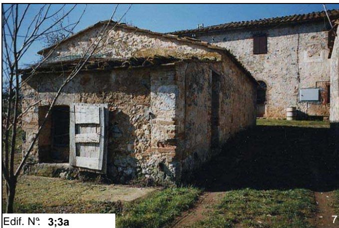
Edif. N° 3;3a