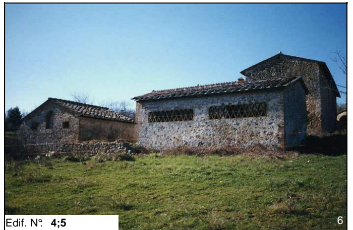
Edif. N° 4;5