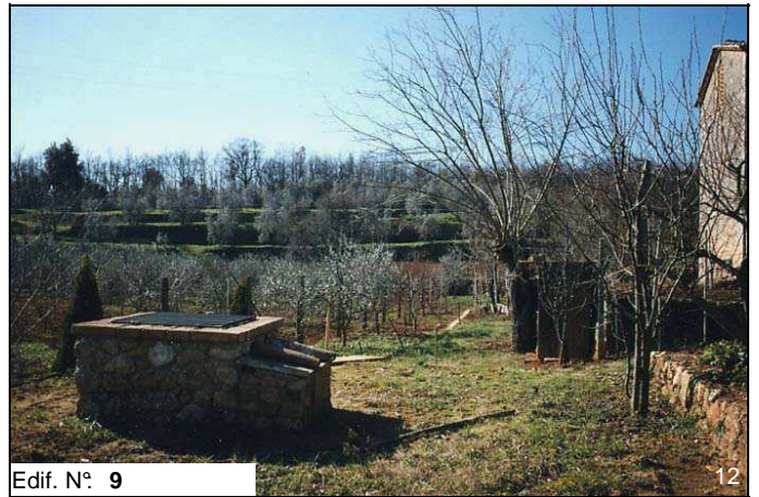
Edif. N° 9