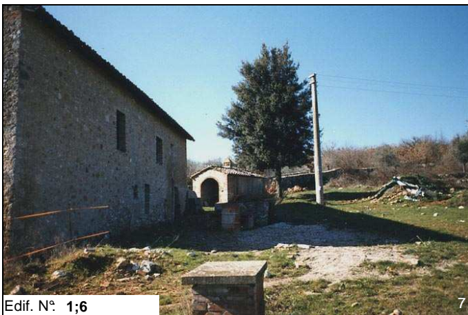
Edif. N° 1;6