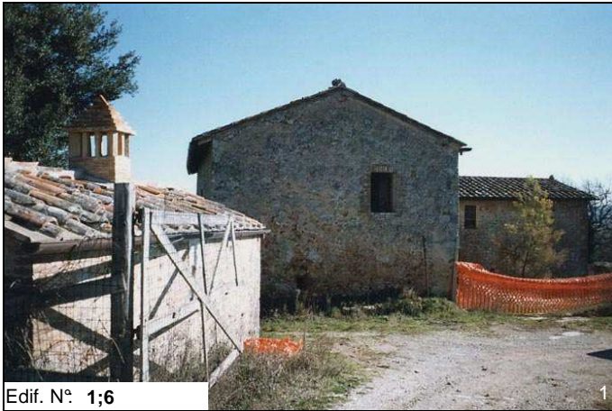
Edif. N° 1;6