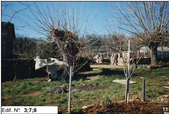
Edif. N° 3;7;8