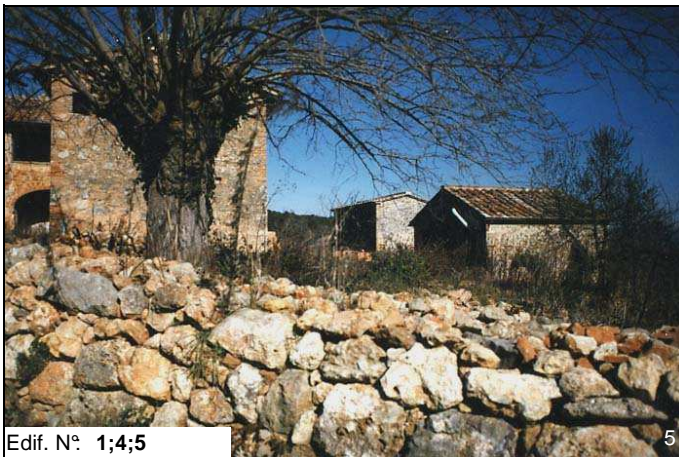
Edif. N° 1;4;5