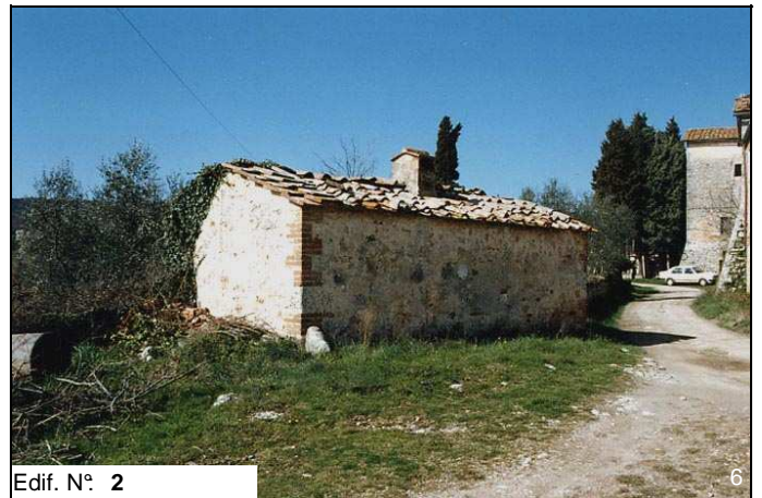
Edif. N° 2