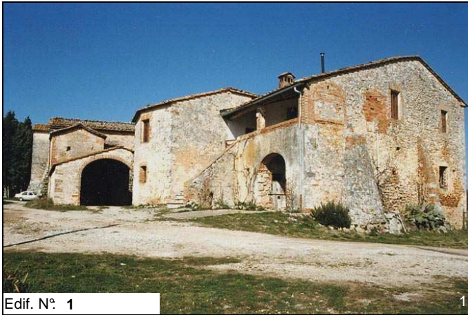
Edif. N° 1