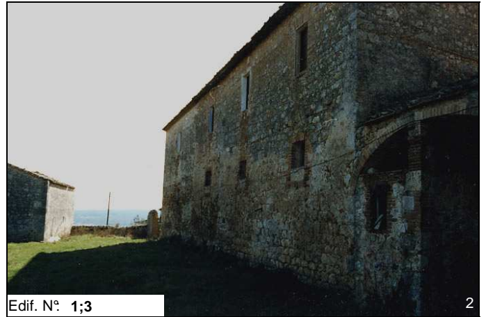
Edif. N° 1;3