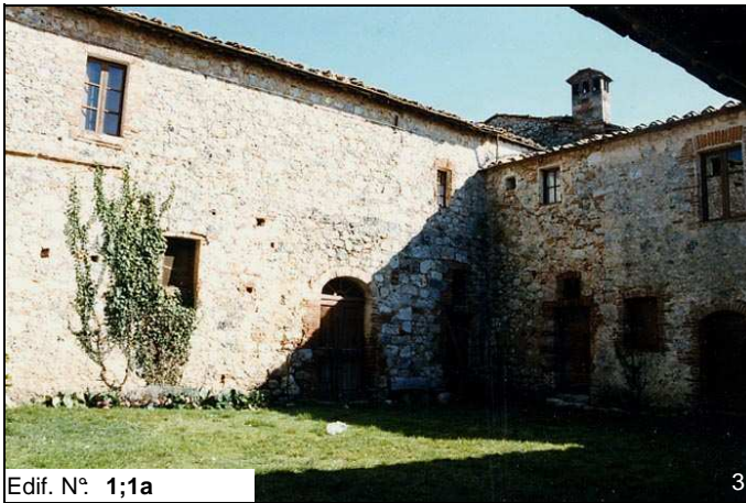
Edif. N° 1;1a