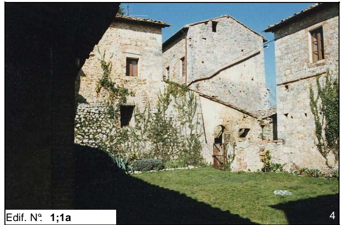
Edif. N° 1;1a