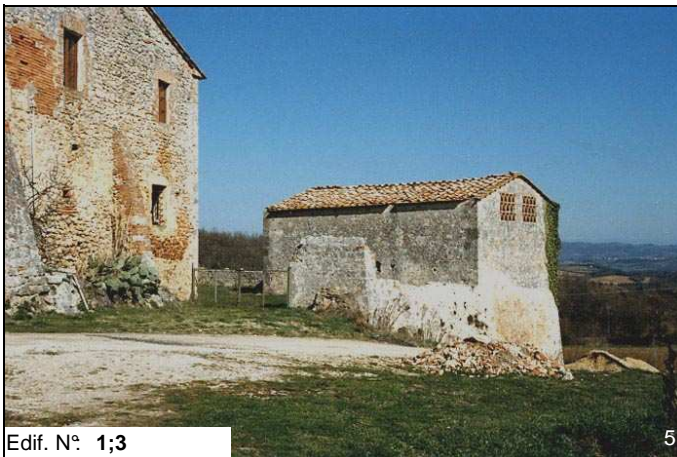
Edif. N° 1;3