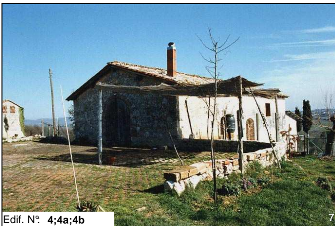
Edif. N° 4;4a;4b