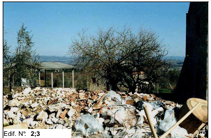
Edif. N° 2;3