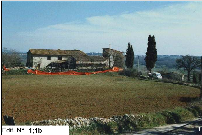
Edif. N° 1;1b