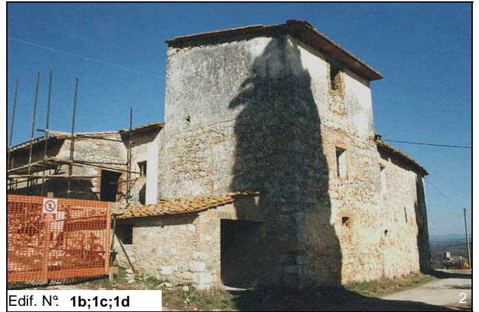
Edif. N° 1b;1c;1d