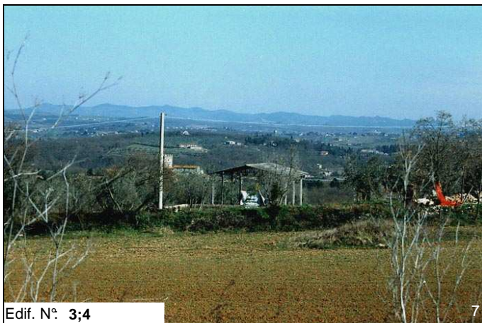
Edif. N° 3;4