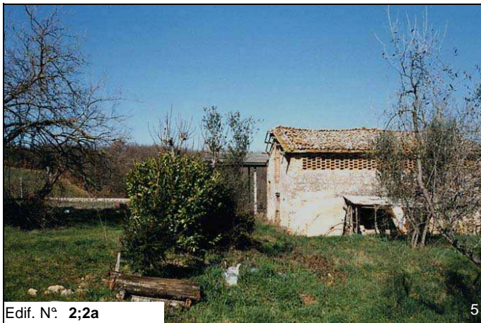
Edif. N° 2;2a