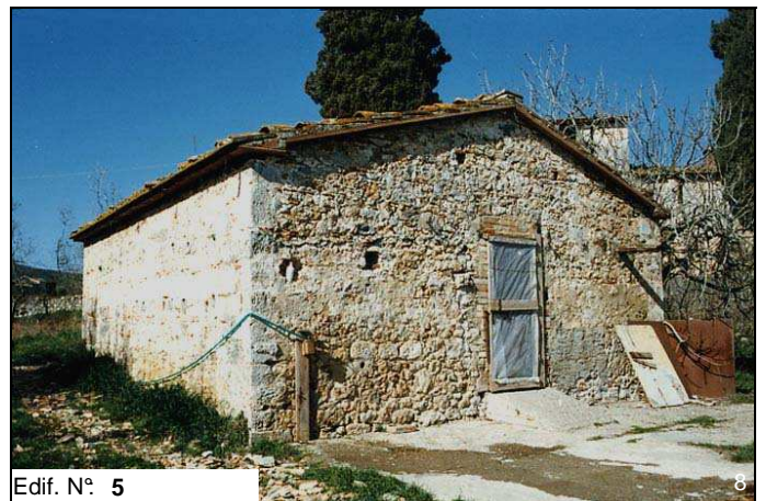
Edif. N° 5