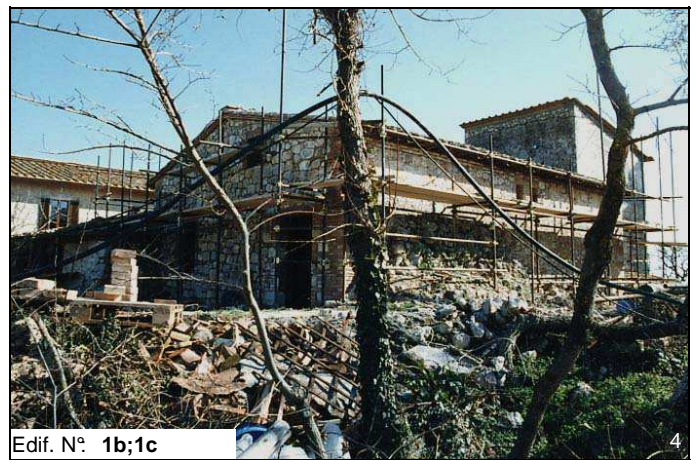
Edif. N° 1b;1c