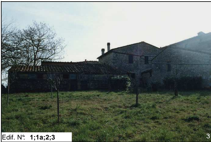
Edif. N° 1;1a;2;3