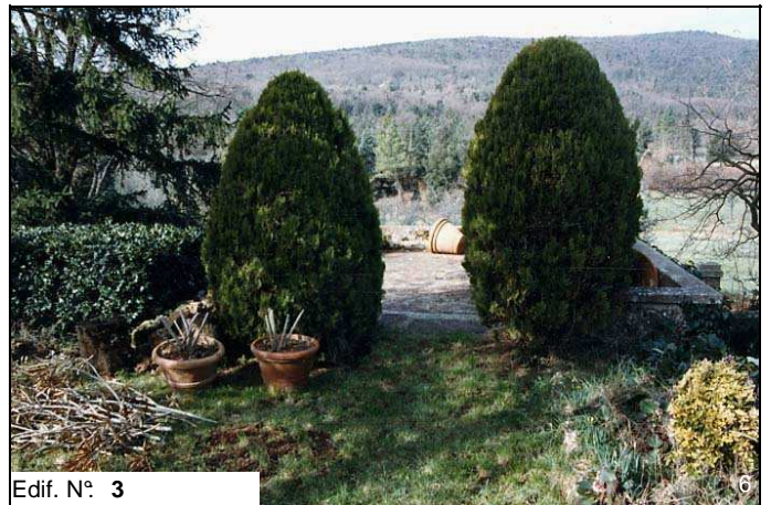
Edif. N° 3