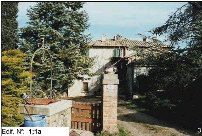
Edif. N° 1;1a