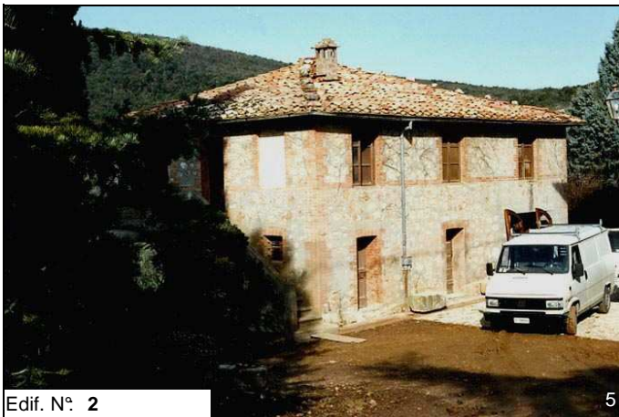
Edif. N° 2