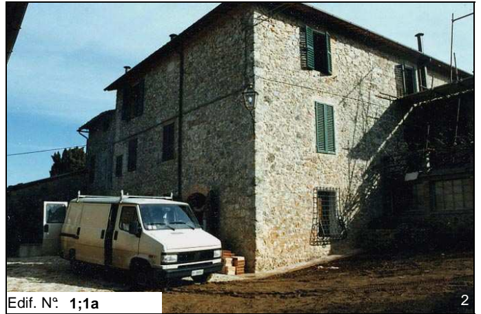
Edif. N° 1;1a