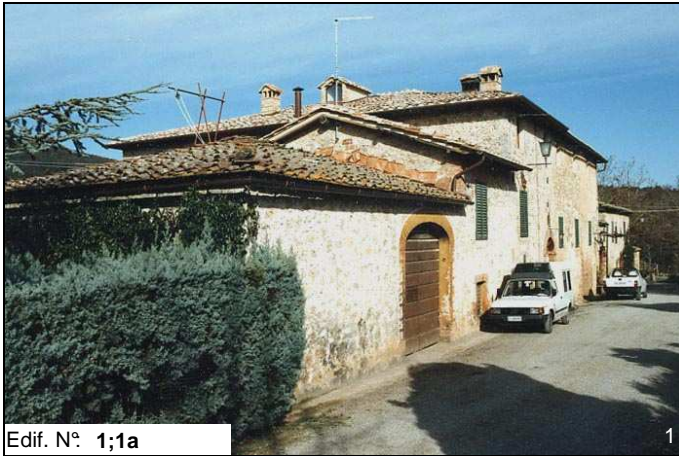
Edif. N° 1;1a