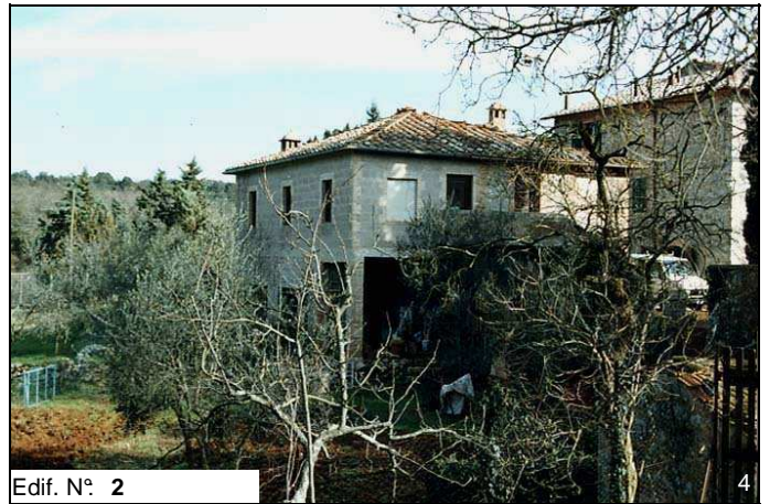
Edif. N° 2