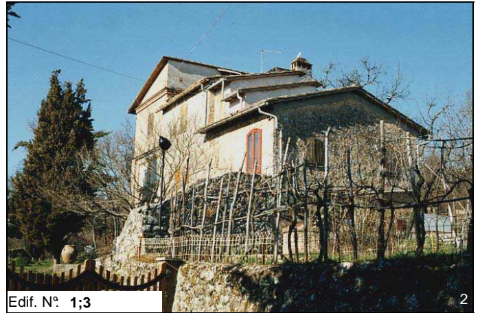
Edif. N° 1;3