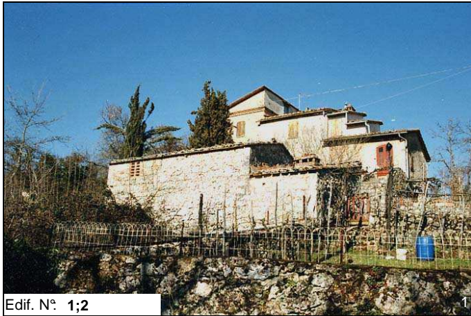
Edif. N° 1;2