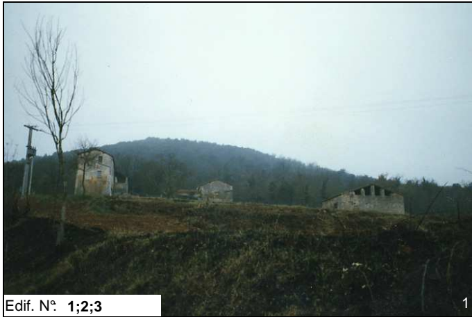
Edif. N° 1;2;3