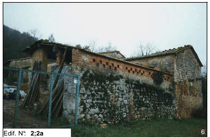
Edif. N° 2;2a