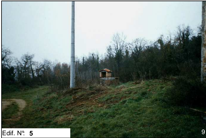
Edif. N° 5