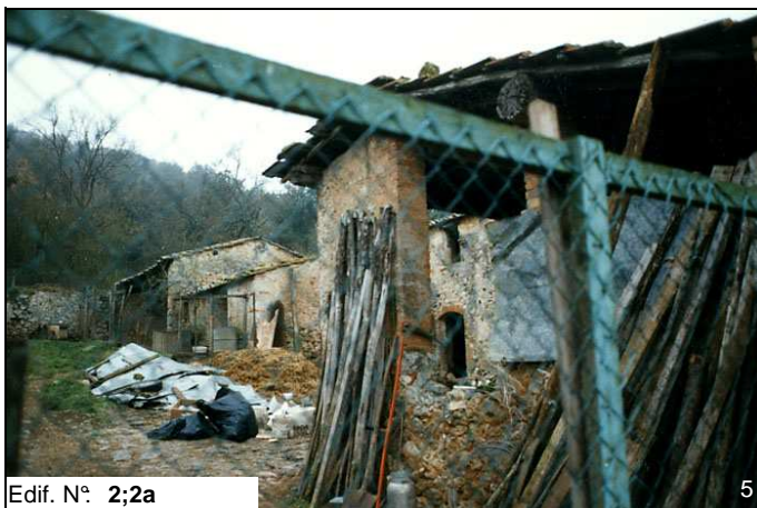
Edif. N° 2;2a