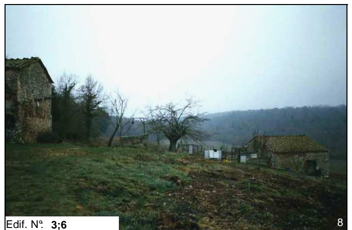
Edif. N° 3;6