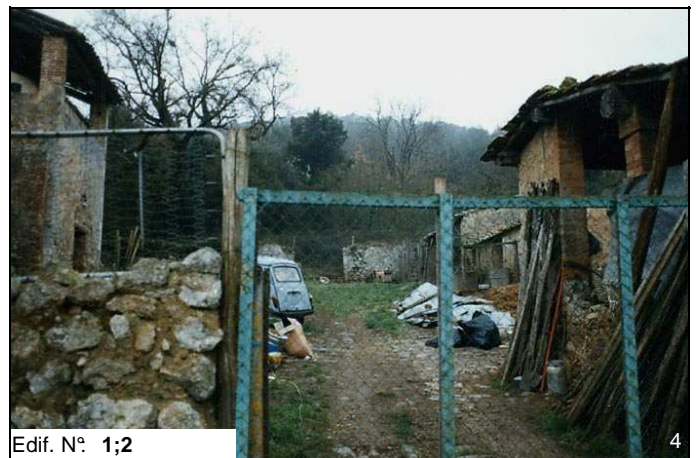
Edif. N° 1;2