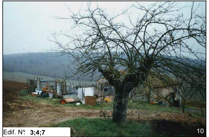
Edif. N° 3;4;7