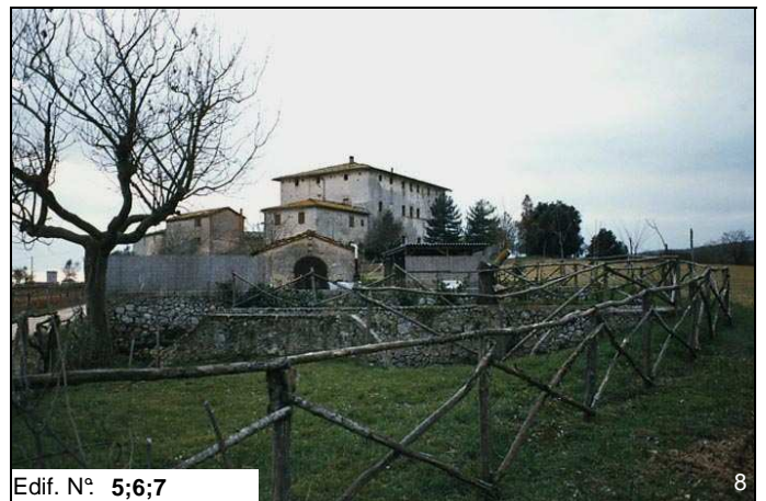
Edif. N° 5;6;7