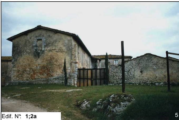
Edif. N° 1;2a