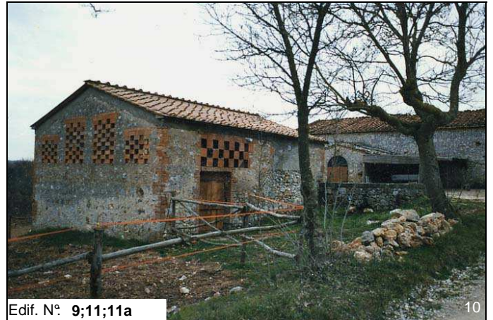
Edif. N° 9;11;11a