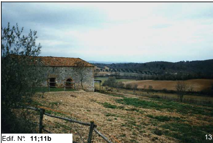
Edif. N° 11;11b