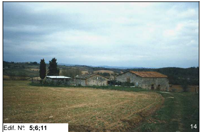
Edif. N° 5;6;11