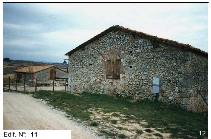
Edif. N° 11